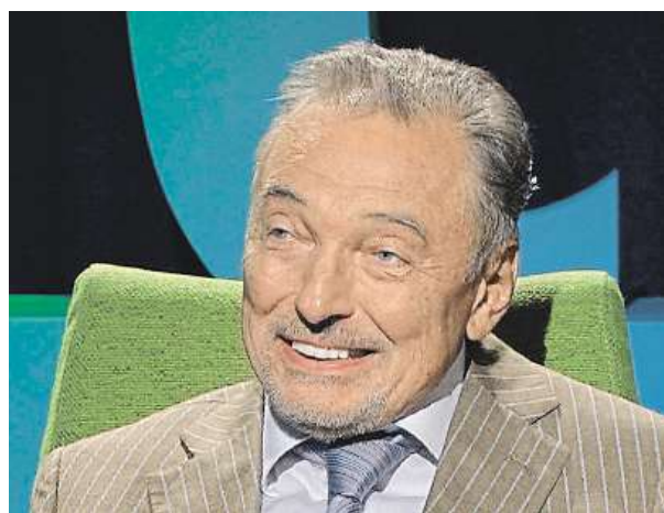
Karel Gott v pořadu Všechnopárty

V prvním dílu podzimní sezony zpovídal moderátor kromě čtyřicetinasobného nositele Slávíka také herečku