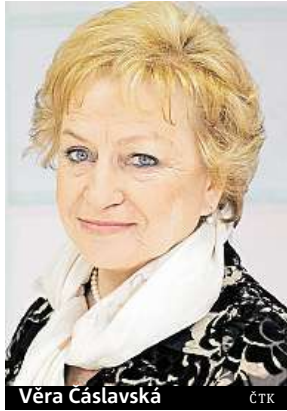
Věra Čáslavská

Gymnastka Věra Čáslavská podlehl rakovině slinivky, se kterou bojovala přes rok.