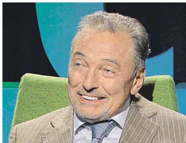
Karel Gott v pořadu Všechnopárty

V prvním dílu podzimní sezony zpovídal moderátor kromě čtyřicetinasobného nositele Slávíka také herečku