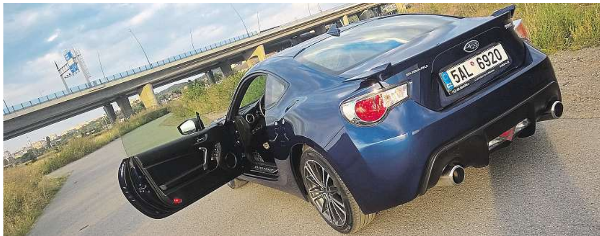
Zadní světlo tvoří dvanáct LED diod. Aerodynamiku vylepšuje žebrovitý design na bocích a zakrytí světel.