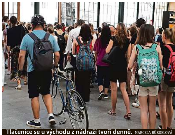
Tláčenice se u vchodu z nádraží tvoří denně. MARCELA BÜRGELOVÁ

„Přitom pokud zde každý den pospícháte na vlak, který má za chvíli odjít, je pro vás důležitá doslova každá vteřina,“ svěřila Metro čtenářka z Klánovic, která si nepřála být jmenována. O ony sekundy však může cestující připravit řada omezení, která tu v důsledku stavebních prací železničářů a developera – investiční skupiny Penta –