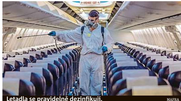
Letadla se pravidelně dezinfikují.

Pro všechny lety, bez ohledu na to, kde jednotlivé aerolinky sídlí, jsou během celého letu povinné mít na nose