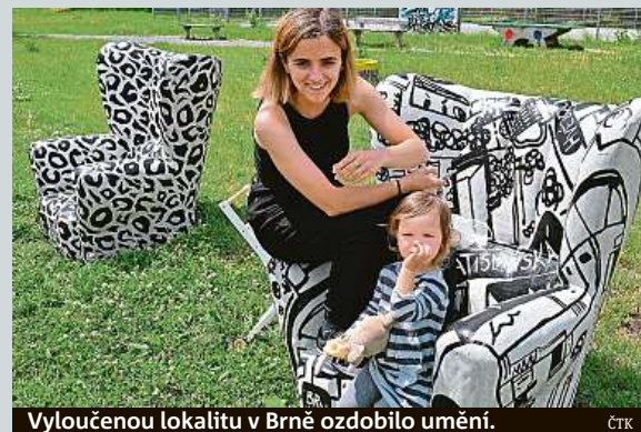
Vyloučenou lokalitu v Brně ozdobilo umění.