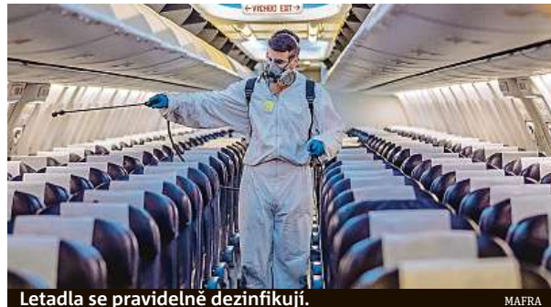
Letadla se pravidelně dezinfikují.

Pro všechny lety, bez ohledu na to, kde jednotlivé aerolinky sídlí, jsou během celého letu povinné mít na nose