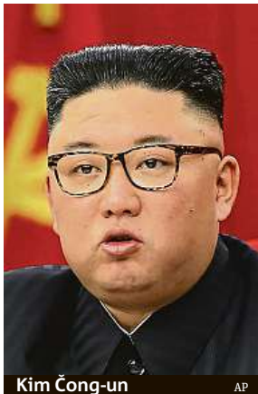
Kim Čong-un

Vůdce KLDŘ odvolal část stranických špiček, důvodem je pronikání covidu do neproniknutelné diktatury.