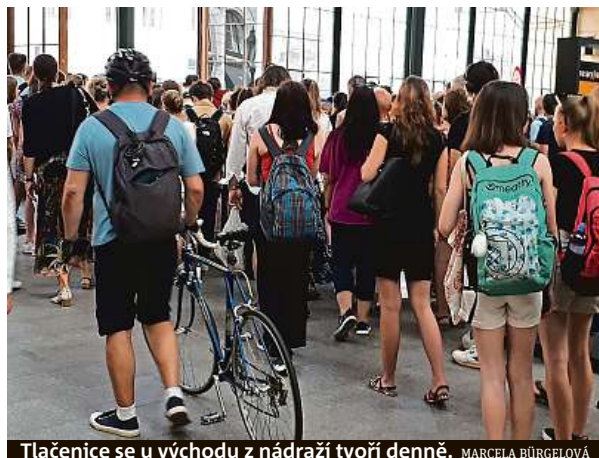
Tlačence se u východu z nádraží tvoří denně. MARCELA BÜRGELOVÁ

„Přítom pokud zde každý den pospícháte na vlak, který má za chvíli odjždět, je pro vás důležitá doslova každá vteřina,“ svěřila Metru čtenářka z Klánovic, která si nepřála být jmenována. O ony sekundy však může cestující připravit řada omezení, která tu v důsledku stavebních prací železničářů a developera – investiční skupiny Penta –