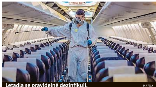
Letadla se pravidelně dezinfikují.

Pro všechny lety, bez ohledu na to, kde jednotlivé aerolinky sídlí, jsou během celého letu povinné mít na nose