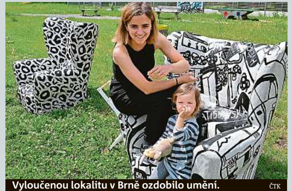
Vyloučenou lokalitu v Brně ozdobilo umění.