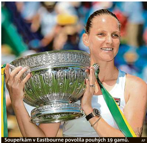
Soupeřkám v Eastbourne povolila pouhých 19 gamů.

V úvodním dnu by mělo zasáhnout do třetího grandslamu sezony celkem pět českých tenistů – těmi dalšími jsou Markéta Vondroušová, Karolína Muchová, Marie Bouzková a Jiří Veselý. SM