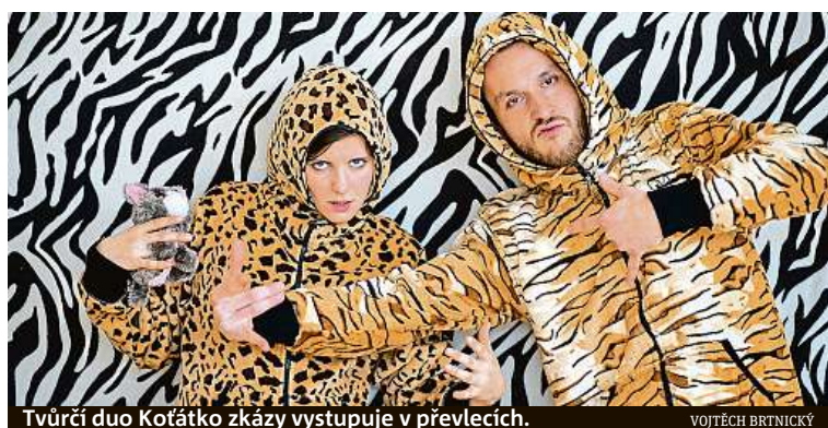
Tvůrčí duo Koťátko zkázy vystupuje v převlecích.