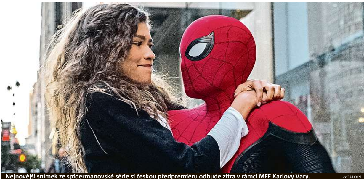
Nejnovější snímek ze spidermanovské série si českou předpremiéru odbude zítra v rámci MFF Karlovy Vary.

Hlavní město za propagaci ve filmu zaplatilo filmovému studiu Marvel pět milionů korun. Tyto peníze byly zaplacené z nadačního fondu Prahy. „Snímek se celosvětovou distribucí a diváčkou základnou město odprezentuje lépe