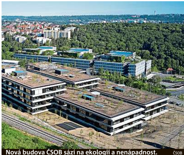
Nová budova ČSOB sází na ekologii a nenápadnost. ČSOB

„Před deseti patnácti lety takové způsoby samozřejmě existovaly, ale byly ještě příliš drahé. Dnes jsou dostupnější, proto jsme je využili,“ říkají autoři stavby, kteří dostali od banky poměrně jasné zadání, co se úspornosti pro-