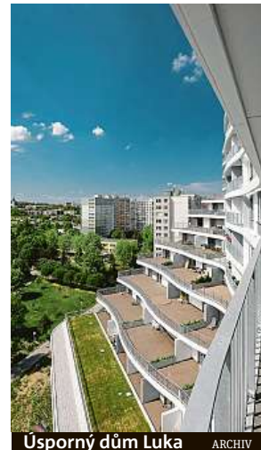
Úsporný dům Luka