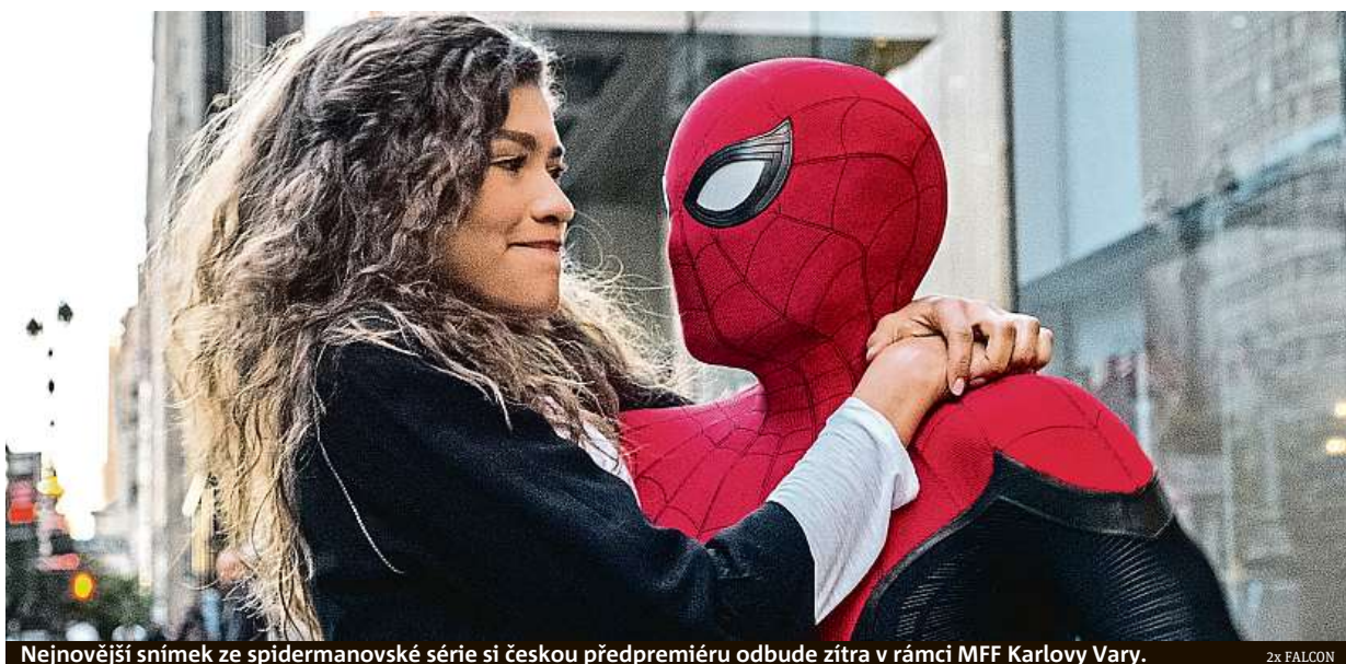
Nejnovejší snímek ze spidermanovské série si českou předpremiéru odbude zítra v rámci MFF Karlovy Vary.

Hlavní město za propagaci ve filmu zaplatilo filmovému studiu Marvel pět milionů korun. Tyto peníze byly zaplacené z nadačního fondu Prahy. „Snímek s celosvětovou distribucí a diváčkou základnou město odprezentuje lépe