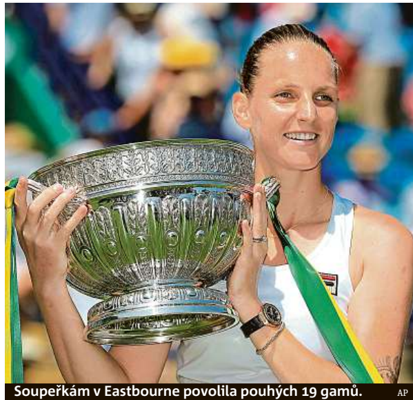
Soupeřkám v Eastbourne povolila pouhých 19 gamů.

V úvodním dnu by mělo zasáhnout do třetího grandslamu sezony celkem pět českých tenistů – těmi dalšími jsou Markéta Vondroušová, Karolína Muchová, Marie Bouzková a Jiří Veselý. SM