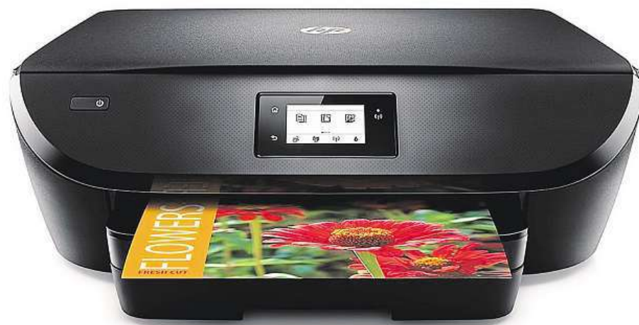
Multifunkční tiskárna HP Deskjet 4535 Ink Advantage

Určený je primárně pro domácnosti, kterým nabídne výbornou kvalitu tisku (včetně duplexu – automatického oboustranného tisku), skenování i kopírování. Všechno s ohledem na co nejušpornější provoz. Peníze rodinnému