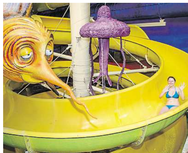
Tobogany v Centru Babylon Liberec