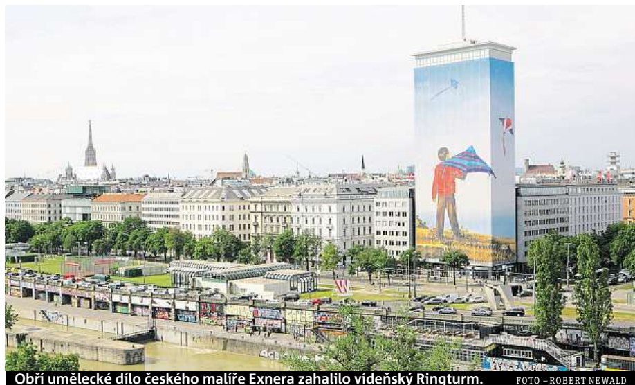
Obří umělecké dílo českého malíře Exnera zahalilo vídeňský Ringturm.

Více než sedmdesát metrů vysoká budova Ringturm ve Vídni se letos v iniciativy Wiener Städtische Versicherungsverein již podeváté proměnila ve velkolepou uměleckou instalaci.