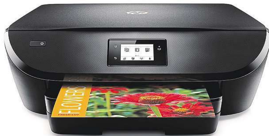
Multifunkční tiskárna HP Deskjet 4535 Ink Advantage

Určený je primárně pro domácnosti, kterým nabídne výbornou kvalitu tisku (včetně duplexu – automatického oboustranného tisku), skenování i kopírování. Všechno s ohledem na co neúspornější provoz. Peníze rodinnému