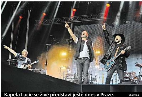
Kapela Lucie se živě představí ještě dnes v Praze.

Už v neděli ale bude kapela Lucie v Karlových Varech. Na 51. ročníku mezinárodního filmového festivalu totiž od 18.30 hodin v Městském divadle uvedou její členové premiéru filmu Lucie: příběh jedné kapely. Uvedení samotného snímku bude předcházet živé natáčení pořadu Na plovárně Marka Ebena s členy kapely, a to i s účastí diváků tohoto představení.