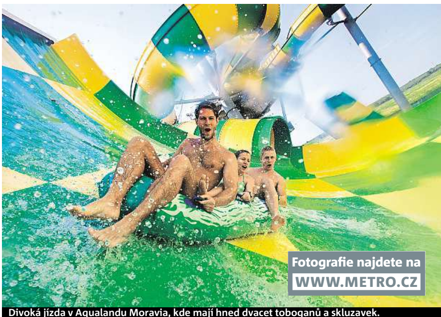
Divoká jízda v Aqualandu Moravia, kde mají hned dvacet toboganů a skluzavek.

Na každý víkend si tu připravují animační programy. Pokud se maminky rády opalují, mohou využít venkovní