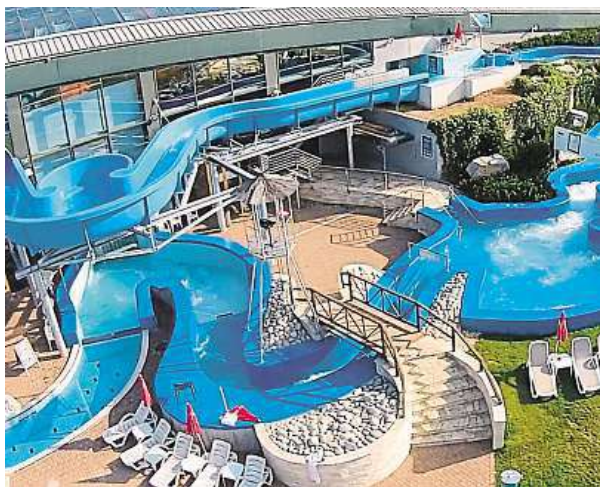
Nejdelší je Canyon s Divokou řekou v Aquapalace Praha.