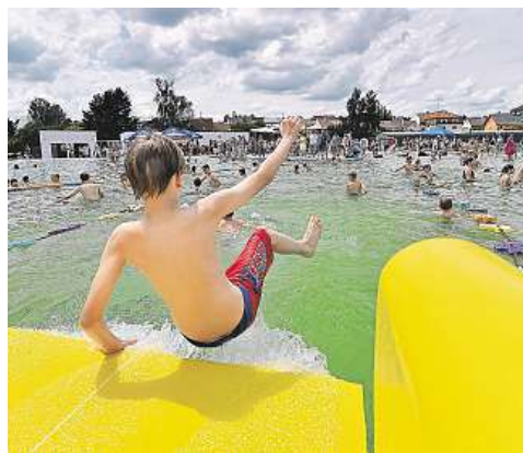
Na Jihlavsku mají nové přírodní koupaliště. Vodu v něm čistí rostliny.