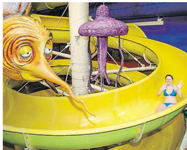
Tobogany v Centru Babylon Liberec