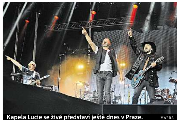
Kapela Lucie se živě představí ještě dnes v Praze.

Už v neděli ale bude kapela Lucie v Karlových Varech. Na 51. ročníku mezinárodního filmového festivalu totiž od 18.30 hodin v Městském divadle uvedou její členové premiéru filmu Lucie: příběh jedny kapely. Uvedení samotného snímku bude předcházet živé natáčení pořadu Na plovárně Marka Ebena s členy kapely, a to i s účastí diváků tohoto představení.