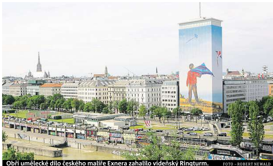
Obří umělecké dílo českého malíře Exnera zahalilo vídeňský Ringturm. FOTO – ROBERT NEWALD

Více než sedmdesát metrů vysoká budova Ringturm ve Vídni se letos v iniciativy Wiener Städtische Versicherungsverein již podeváté proměnila ve velkolepou uměleckou instalaci.