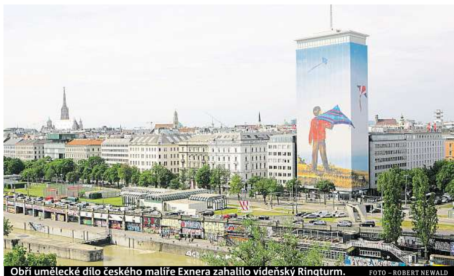
Obří umělecké dílo českého malíře Exnera zahalilo vídeňský Ringturm.