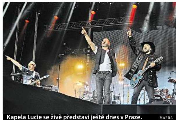
Kapela Lucie se živě představení ještě dnes v Praze.

Už v neděli ale bude kapela Lucie v Karlových Varech. Na 51. ročníku mezinárodního filmového festivalu totiž od 18.30 hodin v Městském divadle uvedou její členové premiéru filmu Lucie: příběh jedny kapely. Uvedení samotného snímku bude předcházet živé natáčení pořadu Na plovárně Marka Ebena s členy kapely, a to i s účastí diváků tohoto představení.