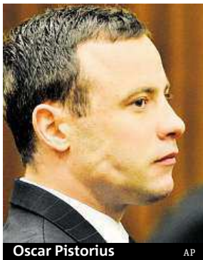
Oscar Pistorius

Paralympijský šampion Oscar Pistorius netrpěl žádnou duševní poruchou, když vloni v únoru zastřelil ve svém domě přítelkyni Reeveu Steenkampovou. Vyplývá to ze zprávy lékařů, kteří v červnu zkoumali jeho psychický stav. Výsledky vyšetření včera předložili soudu v Pretorii. Proces se tak včera znovu rozběhl po měsíčním odročení, během něhož musel Pistorius podstoupit sérii psychiatrických testů. ČTK