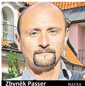
Zbyněk Passer MAFRA