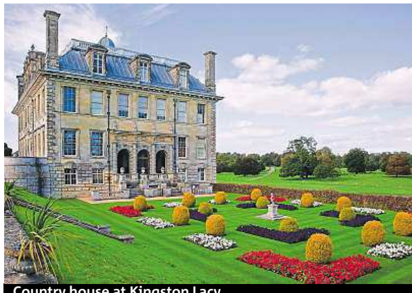
Country house at Kingston Lacy

An interesting way to meet some 5 _____ people is to volunteer to help with one of the projects that the National Trust runs. If you are over 18, you could work on your 6 _____ skills, in an historic building or even take part in an archaeological dig. Or for the more relaxing alternative take a break in one of the properties that they own. It will all help to preserve these fascinating sites. PHILIPPA ROBERTS