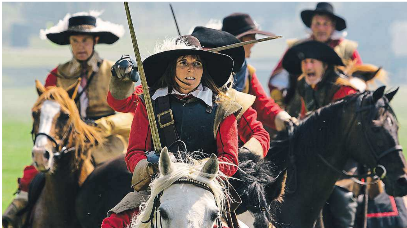
English Civil War Society members re-enact the Battle of Chippenham.