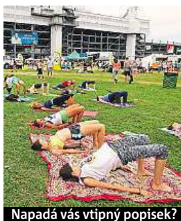
Napadá vás vtipný popisěk?

Napište bublinu a reagujte na sloupek na: www.facebook.com/denikmetro