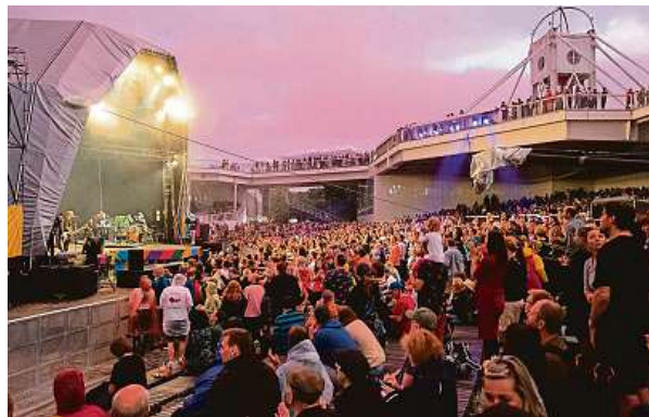
Takto vypadala atmosféra na Výstavišti Praha v Holešovicích loni. Letos se očekává opět velký zájem diváků.

Všechno nádobí na festivalu je vratné a recyklovatelné, k dispozici bude široká nabídka jídla i pití.