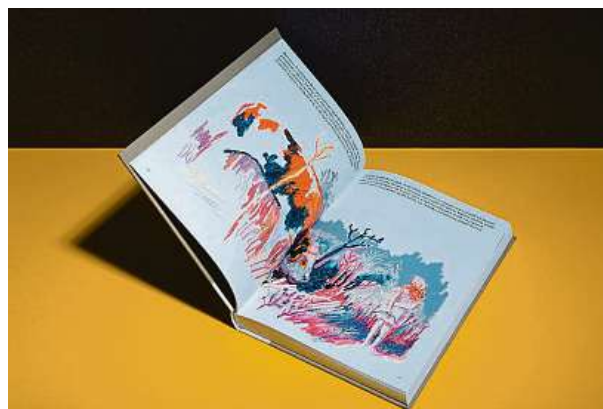
V soutěži Nejkrásnější české knihy roku 2022 získala kniha Mařka Cenu SČUG Hollar za vynikající ilustrační doprovod. 2x BY-WO-MEN.COM