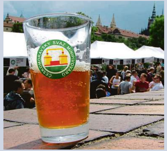
Festival se koná v prostorách Královské zahrady.