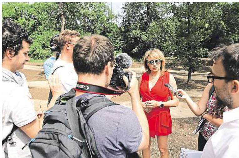
Pražská primátorka Adriana Krnáčová včera představila svou vizi nového Výstaviště na procházce s novináři.