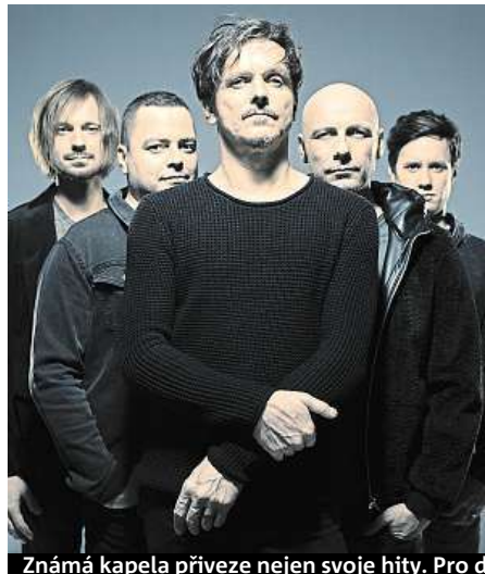
Známa kapela přiveze nejen svoje hity. Pro děti se chystá Pigyáda.