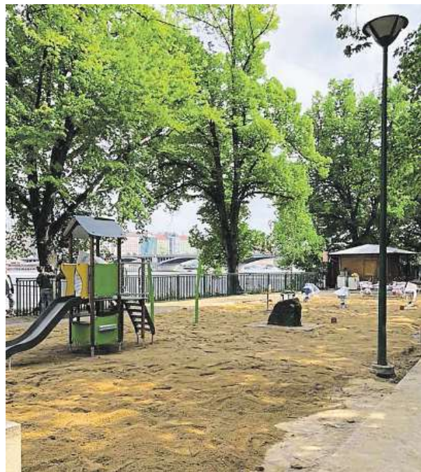
Dětský ostrov měsíc před otevřením

Děti do 15 let dnes od 9.30 do 16 hodin na ostrově čekají skákací hrady, malování na obličej nebo možnost vyzkoušet si širokou škálu nově vybudovaných sportovišť. Během čtyřměsíčních úprav totiž na ostrově přibyla nová hřiště na fotbal, volejbal, streetball a další sporty, pro menší děti pak nový kolotoč, prolézačky, pískoviště nebo speciální dopadová plocha na různé míčové hry. FILIP JAROŠEVSKÝ