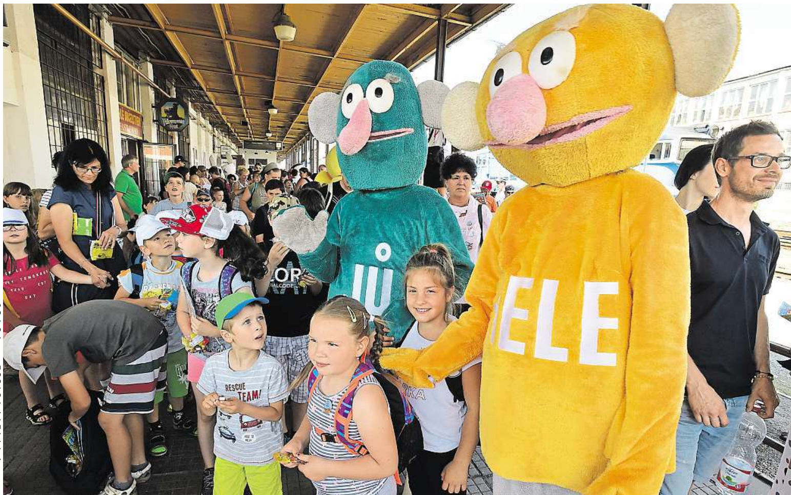
Vlak plný úsměvů včera přivezl děti z dětských domovů z celé republiky do dějiště Mezinárodního filmového festivalu pro děti a mládež. Koná se ve Zlíně. ČTK

Průzkum. Podle finančních ústavů si nenecháme od odborníků příliš radit. Peníze. Žijeme od výplaty k výplatě, ale hlavu si tím moc nelámeme. Šťěstí. Důležitější je pro nás spíše zdraví nebo děti STRANA 8