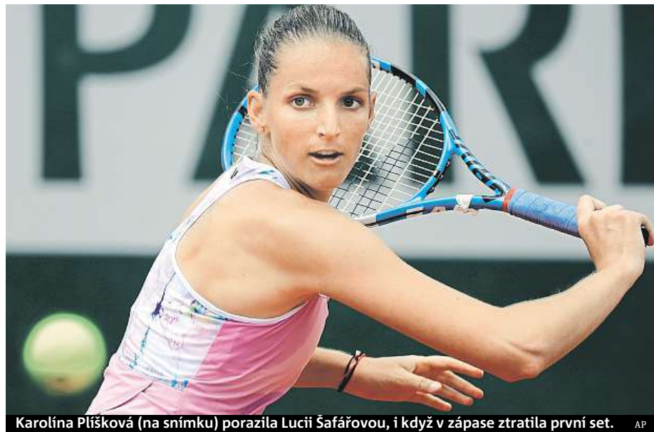
Karolína Plíšková (na snímku) porazila Lucii Šafářovou, i když v zápase ztratila první set.

Karolína Plíšková porazila na tenisovém French Open další krajanku.