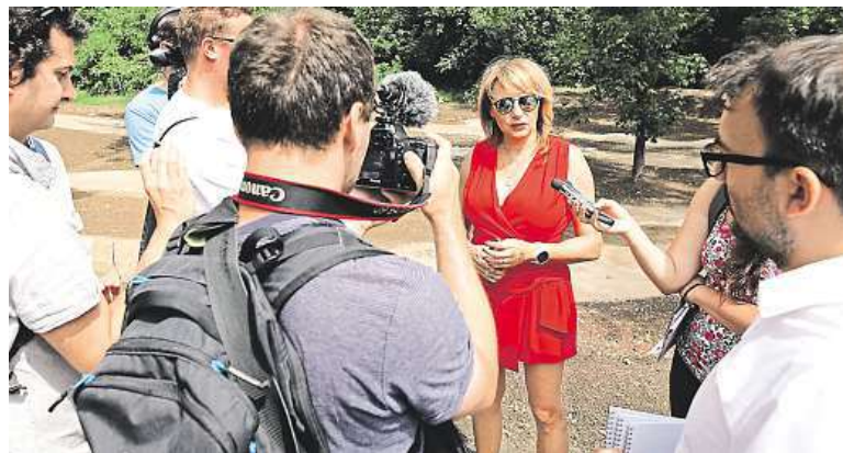
Pražská primátorka Adriana Krnáčová včera představila svou vizi nového Výstaviště na procházce s novináři.