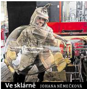
Ve sklárně JOHANA NĚMEČKOVÁ

Dnes budou moci návštěvníci nahlédnout pod ruce mistrů brusičů a zároveň zjistit, jak funguje unikátní robotické broušení přímo ve sklárně Bomma. Návrhy do kategorie robotického brusku jsme poslali nejen my, ale i další art direktori českých sklářských značek, jako je Rückl, Moser či Preciosa. Zítra proběhne na zámku Světlá nad Sázavou vyhlášení výsledků brusičské soutěže v obou kategoriích. Poprvé v tomto roce se pro veřejnost otevrou i dveře sklárny, kterou si tak budou moci návštěvníci v průběhu celé soboty sami prohlédnout.