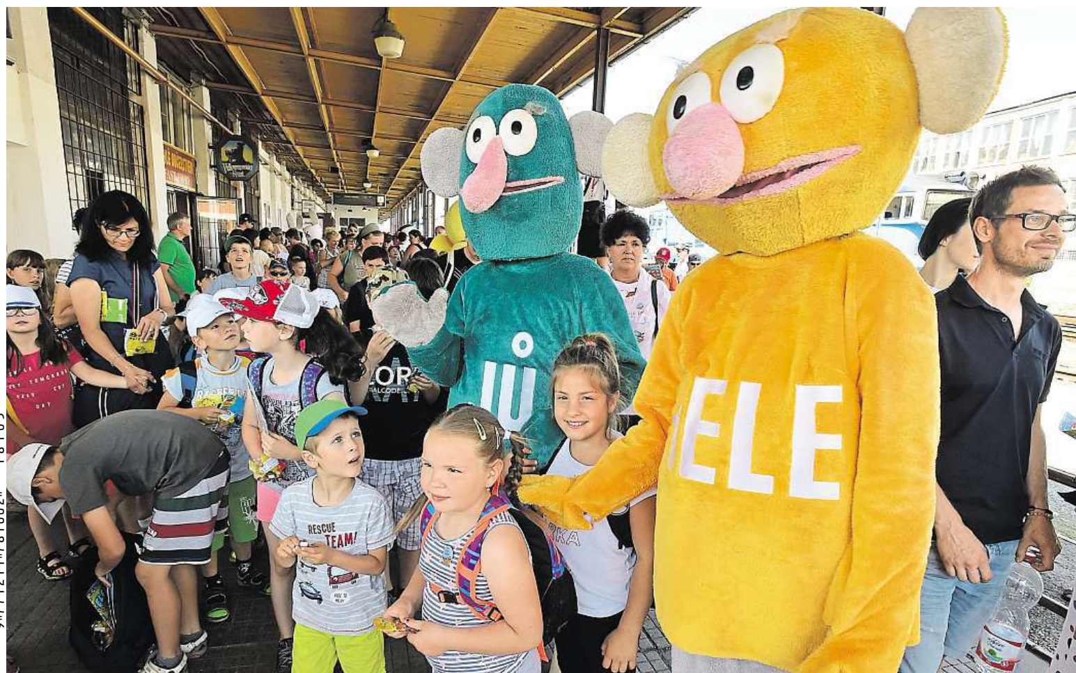
Vlak plný úsměvů včera přivezl děti z dětských domovů z celé republiky do dějiště Mezinárodního filmového festivalu pro děti a mládež. Koná se ve Zlíně. ČTK

Průzkum. Podle finančních ústavů si nenecháme od odborníků příliš radit. Peníze. Žijeme od výplaty k výplatě, ale hlavu si tím moc nelámeme. Šťěstí. Důležitější je pro nás spíše zdraví nebo děti STRANA 2