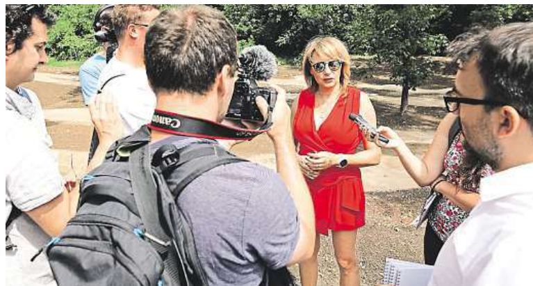
Pražská primátorka Adriana Krnáčová včera představila svou vizi nového Výstaviště na procházce s novináři.