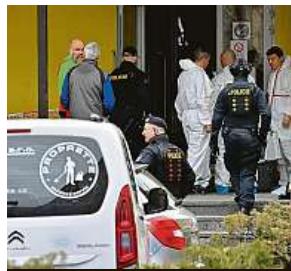
Na místo brutálního útoku přijel také ministr Gazdík.