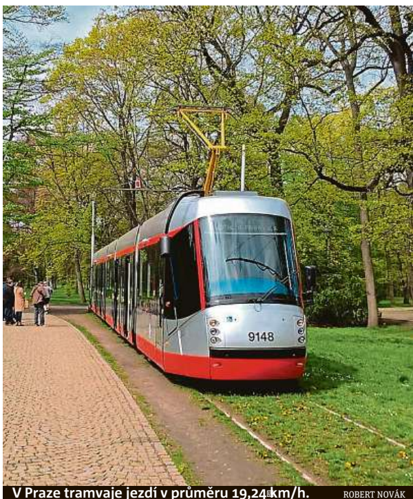
V Praze tramvaje jezdí v průměru 19,24 km/h.

Touto rychlostí v kilometrech za hodinu mohou od září 2020 jezdit ostravské tramvaje. Dopravní podnik Ostrava tehdy dokončil rekonstrukci trati do Poruby za 130 milionů korun. Bylo to vůbec poprvé, kdy se v České republice lidé v tramvajích mohli svést až takovou rychlostí.