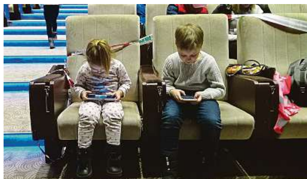
Hlavní sál se stal dočasným útlukem ukrajinských běženců.