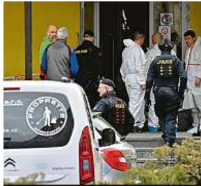
Na místo brutálního útoku přijel také ministr Gazdík.