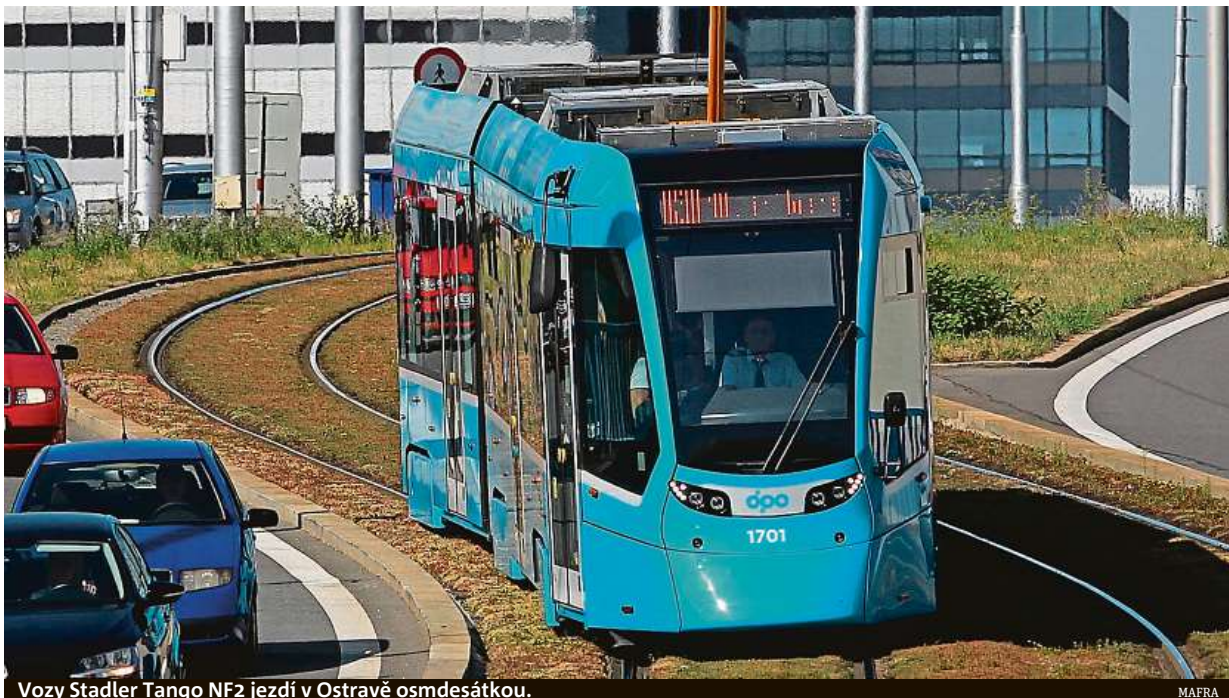
Vozy Stadler Tango NF2 jezdí v Ostravě osmdesátkou.

Rozhodli se spočítat průměrné rychlosti jednotlivých tramvajových linek v Česku. První místo obsadila mostecká linka číslo tři. Nejpomalejší tramvaje má naopak Olomouc. „Zatímco tramvaje Dopravního podniku měst Most a Litvínov mají průměrnou rychlost 26,54 km/h, olomoucké linky jezdí průměrnou rychlostí 17,80 km/h. Hlavním důvodem je charakteristika tratí. Na Mostecku se přibližují tramvaje rychlodráze se