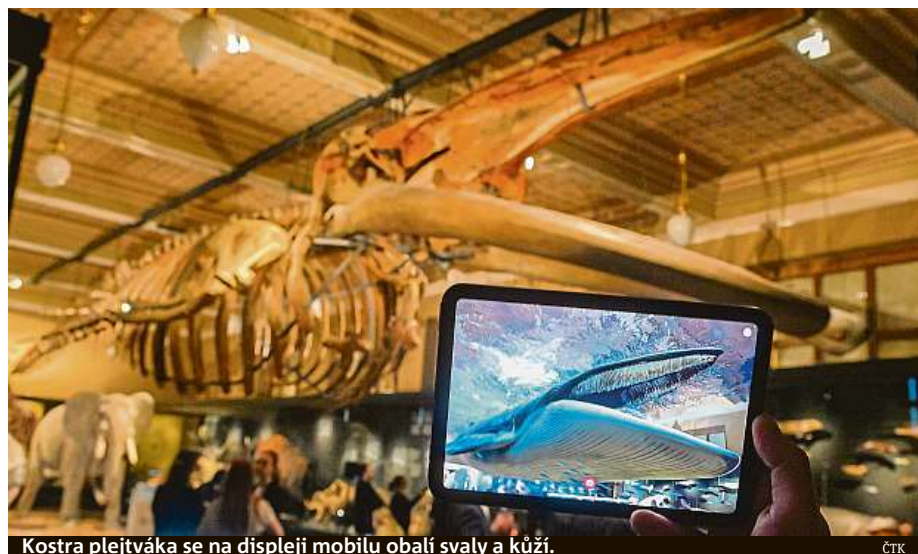
Kostra plejtváka se na displeji mobilu obalí svaly a kůží.