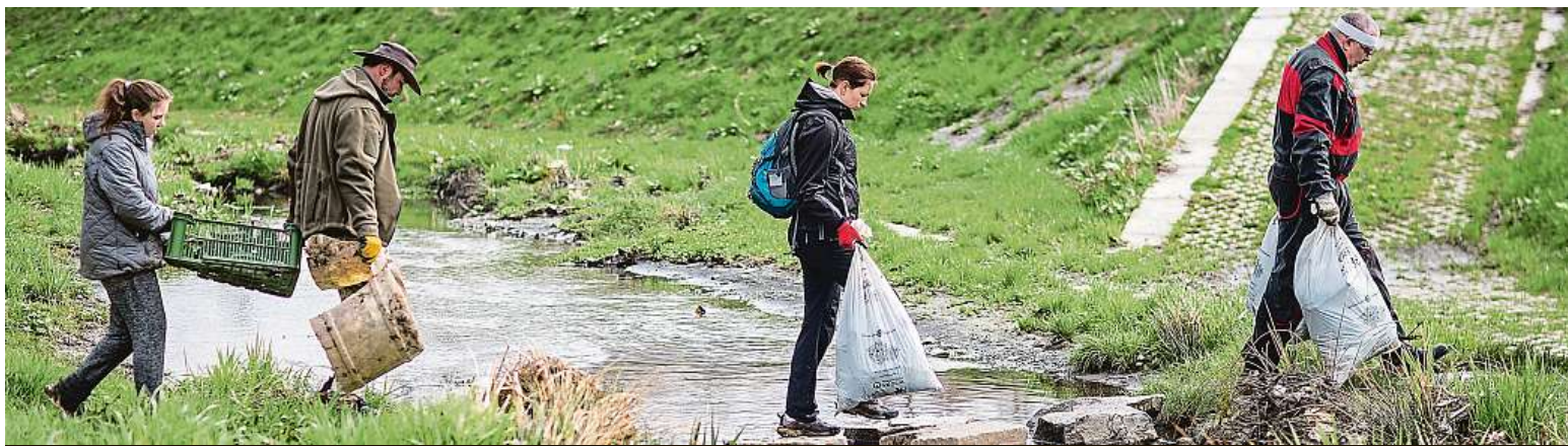
Do úklidu okolí se zapojují nejen party lidí, ale také celé rodiny. Kompletní seznam míst a registraci naleznete na www.uklidmecsko.cz .