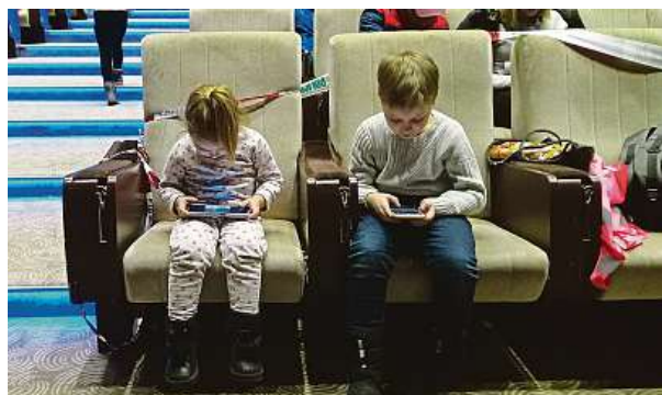
Hlavní sál se stal dočasným útlukem ukrajinských běženců.

Já ne. Ctím to, že i kdybych měla jet domů jenom na dvě hodiny, tak jedu. Nebyla jsem ta, která tu nocovala. Určitě bych chtěla vyzdvihnout naši vedoucí produkce. Ta první noc, kdy se stavělo uprchlické centrum, spala jen hodinu a půl. Já musím poděkovat. PAVEL HRABICA