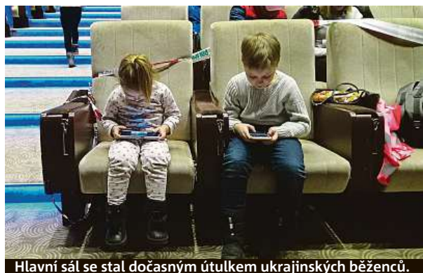
Hlavní sál se stal dočasným útlukem ukrajinských běženců.