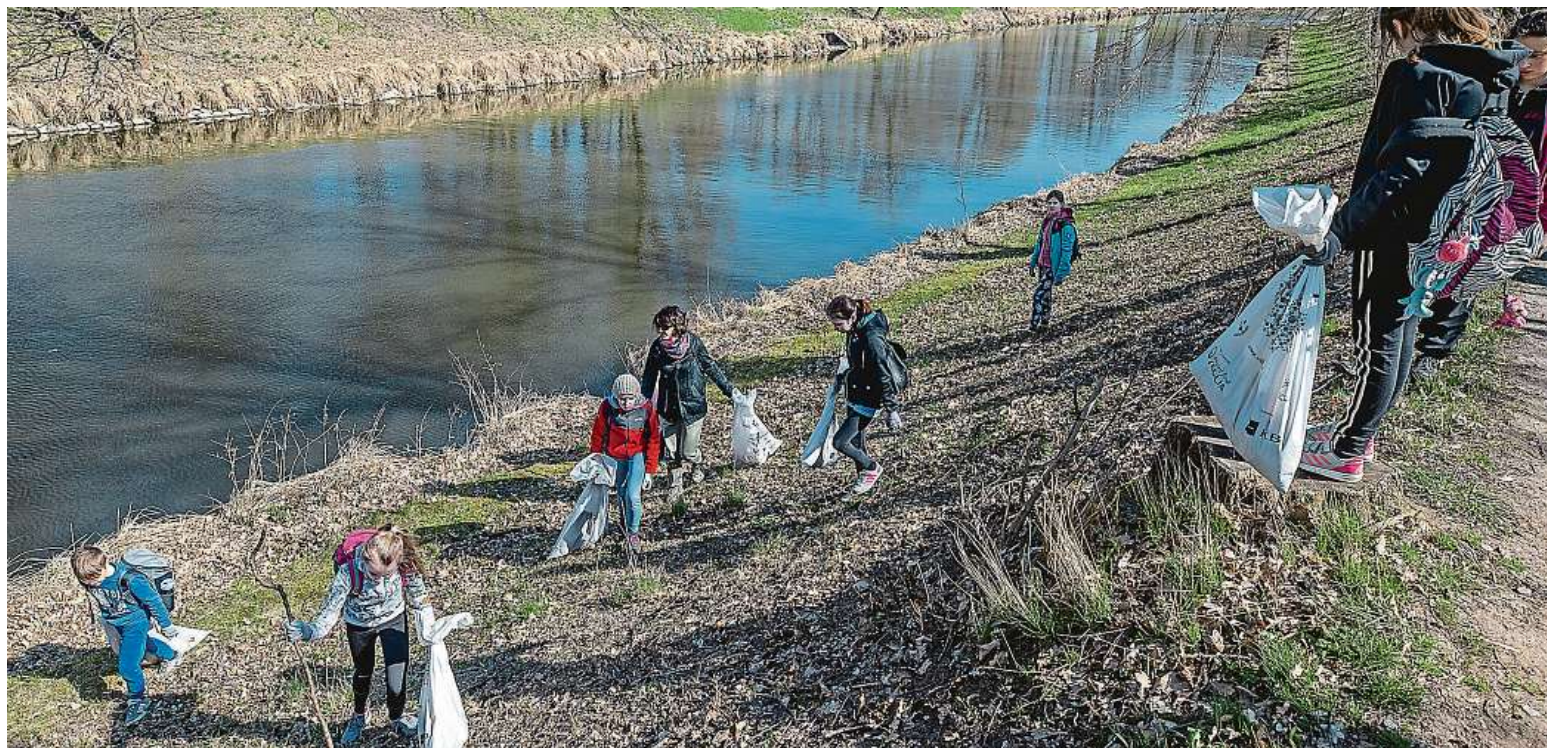
Do úklidu okolí se zapojují nejen party lidí, ale také celé rodiny. Kompletní seznam míst a registrací naleznete na www.uklidmecesko.cz .