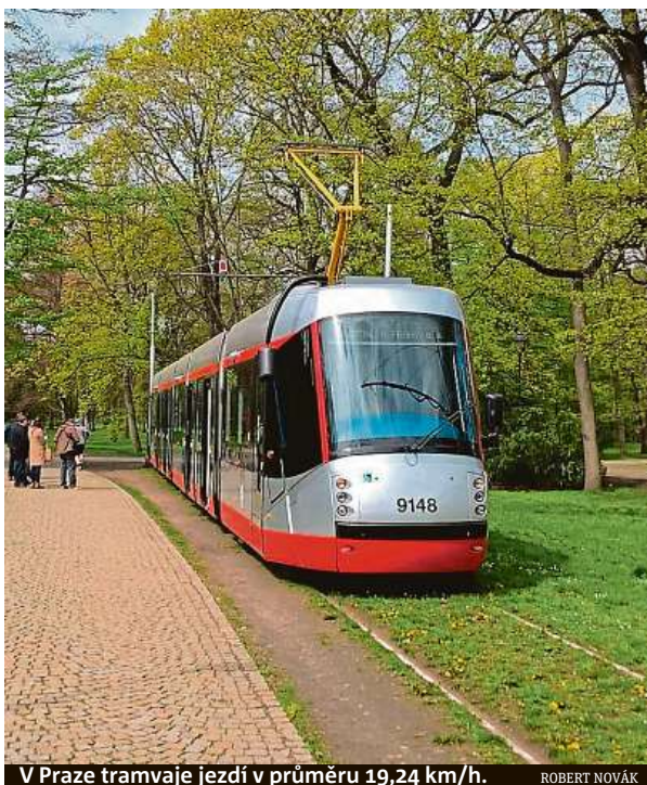
V Praze tramvaje jezdí v průměru 19,24 km/h.

FILIP JAROŠEVSKÝ filip.jarosevsky@metro.cz