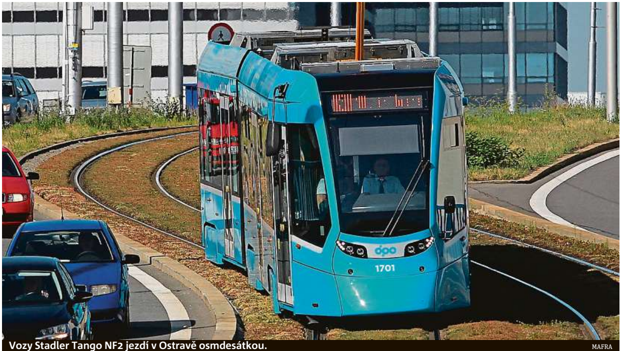
Vozy Stadler Tango NF2 jezdí v Ostravě osmdesátkou.

Rozhodli se spočítat průměrné rychlosti jednotlivých tramvajových linek v Česku. První místo obsadila mostecká linka číslo tři. Nejpomalejší tramvaje má naopak Olomouc. „Zatímco tramvaje Dopravního podniku měst Most a Litvínov mají průměrnou rychlost 26,54 km/h, olomoucké linky jezdí průměrnou rychlostí 17,80 km/h. Hlavním důvodem je charakteristika tratí. Na Mostecku se přibližují tramvaje rychlodráze se značným oddělením od ostatních druhů do-