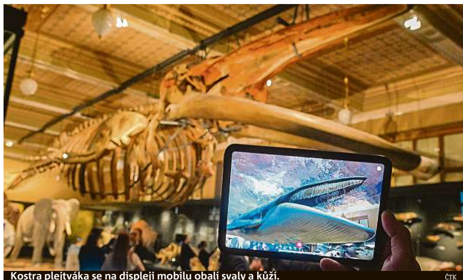
Kostra plejtváka se na displeji mobilu obalí svaly a kůží.