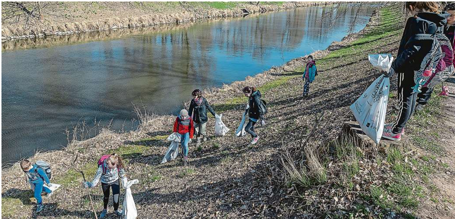
Do úklidu okolí se zapojují nejen party lidí, ale také celé rodiny. Kompletní seznam míst a registrací naleznete na www.uklidmecesko.cz .