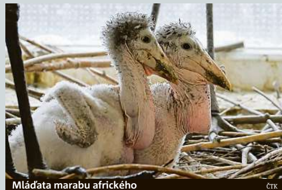
Mláděta marabu afrického