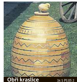
Obří kraslice 3x 5 PLUS 2

Zajímavá je také obří kraslice z javorového dřeva. Výroba zabrala jeho tvůrce Antonína Hájkovi více než dva roky.