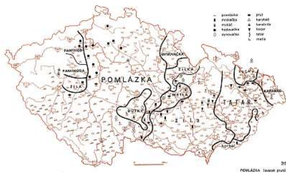
A co se z vrbových proutků plete u vás? ČESKÝ JAZYKOVÝ ATLAS