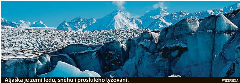
Aljaška je zemí ledu, sněhu i proslulého lyžování.