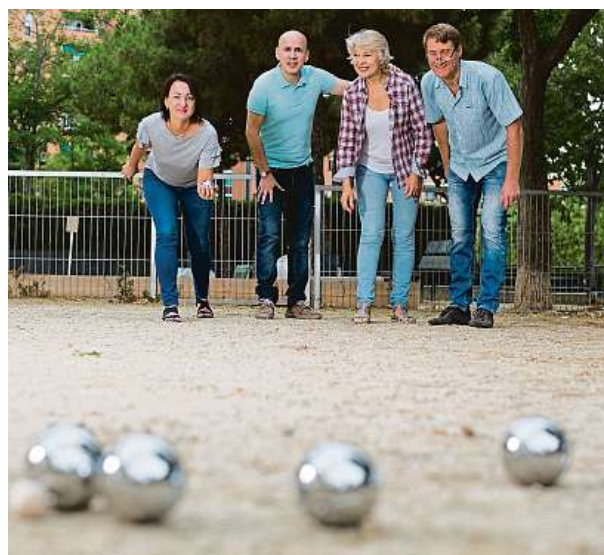
Pétanque je zábava pro všechny generace.

Na discgolf sice potřebujete hřiště se speciálními koši, na druhou stranu už jich je v Česku přes sto. Na začátek vám stačí základní disk. U kanjamu musíte mít kromě létacího talíře dva plastové koše vzdálené od sebe 15 metrů. Hrají ideálně dva dvoučlenné týmy. Jeden člen hází od svého koše na soupeřův, kde může spoluhráč disk usměrnit. Vítězí dvojice, která první dosáhne 21 bodů.