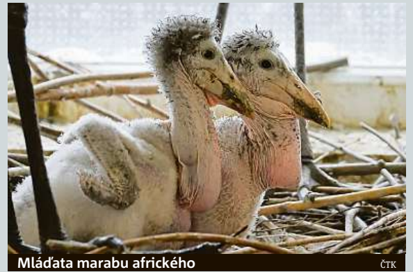
Mláděta marabu afrického