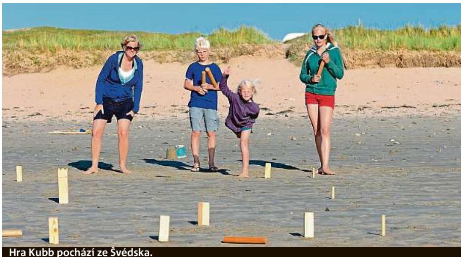
Hra Kubb pochází ze Švédska.