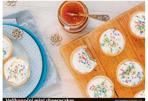
Velikonoční mini cheesecakes

Pro 4 osoby potřebujeme: 1 kostku droždí, 100 g cukru krupice, 200–250 ml mléka, 500 g polohrubé mouky,