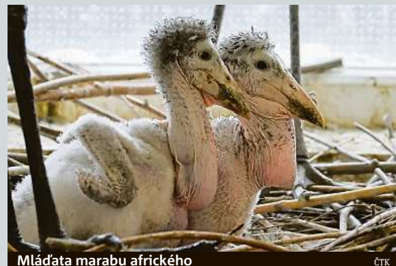
Mláděta marabu afrického