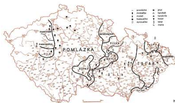
A co se z vrbových proutků plete u vás?