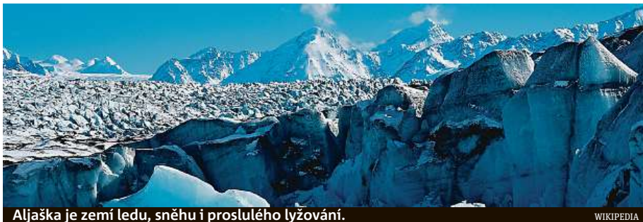
Aljaška je zemí ledu, sněhu i proslulého lyžování.