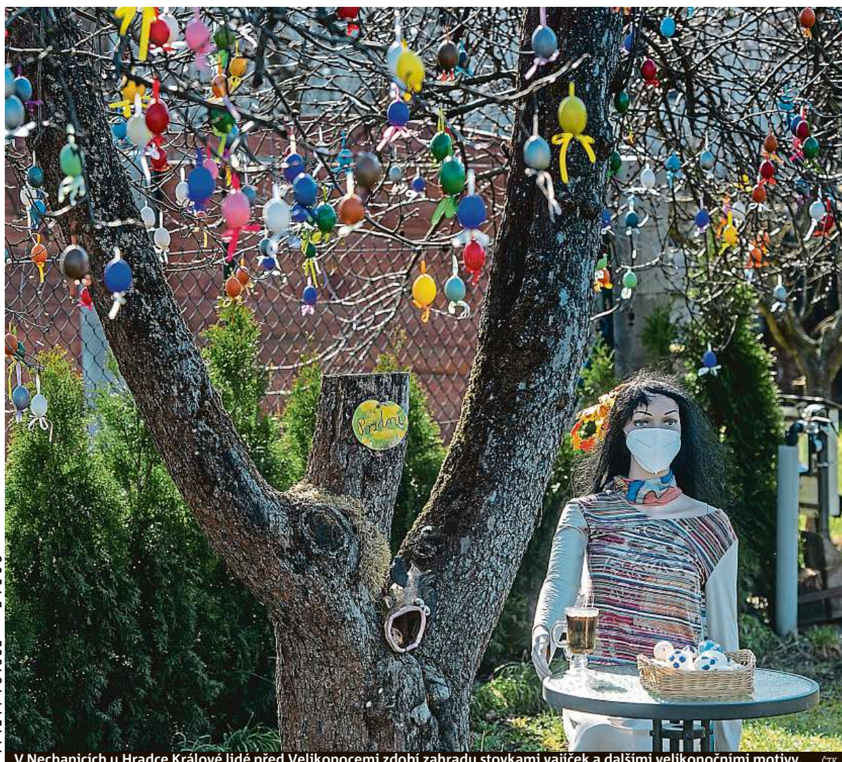
V Nechanicích u Hradce Králové lidé před Velikonocemi zdobí zahradu stovkami vajíček a dalšími velikonočními motivy.