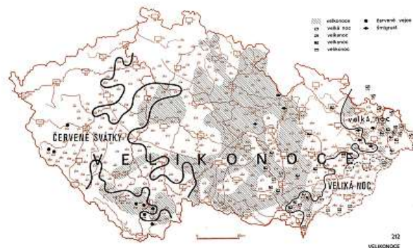
Nářečí zanikají. Uchovává je alespoň Český jazykový atlas.

A na závěr se můžete potěšit velikonoční říkankou z Podkrkonoší: „Hody hody vejce, chytili sme strejce. Dali sme ho do kurníka, aby snášel vejce.“ PETRA PŘADKOVÁ, újč