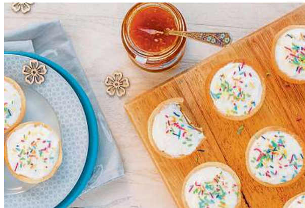
Velikonoční mini cheesecakes

Pro 4 osoby potřebujeme: 1 kostku droždí, 100 g cukru krupice, 200–250 ml mléka, 500 g polohrubé mouky,