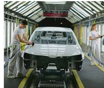
V lakovně ŠKODA AUTO se pracuje v moderním a čistém prostředí.

Ano, potřebujeme šikovné lakýrníky a karosáře, s praxí i bez. Zaučíme každého.