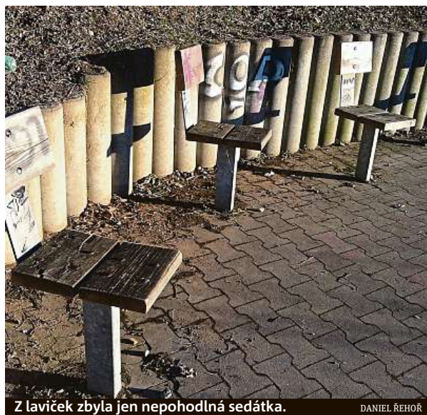
Z laviček zbyla jen nepohodlná sedátka.