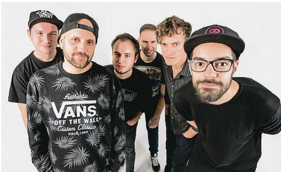
Informace o koncertech najdete také na facebookovém profilu Fast Food Orchestra.