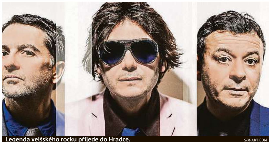
Legenda velšského rocku přijede do Hradce.