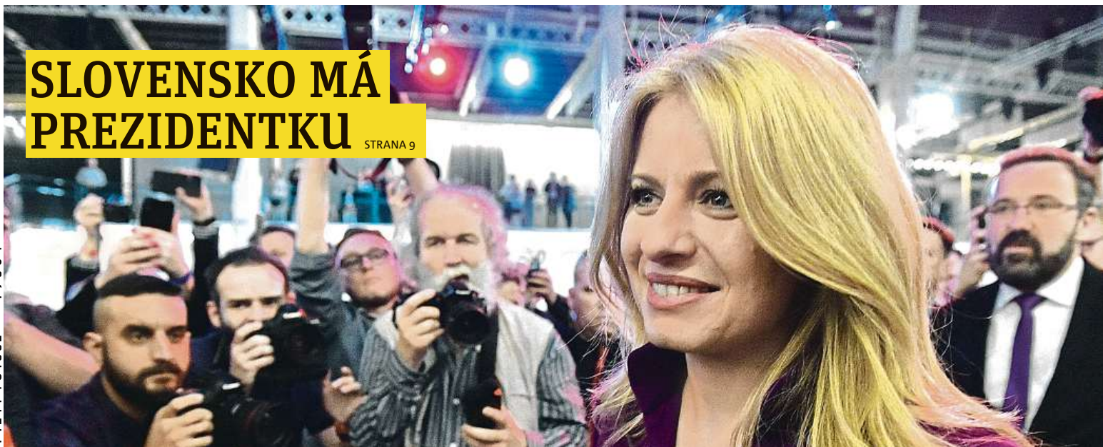
Právnička Zuzana Čaputová zvítězila v druhém kole prezidentských voleb nad eurokomisařem Marošem Šefčovičem.