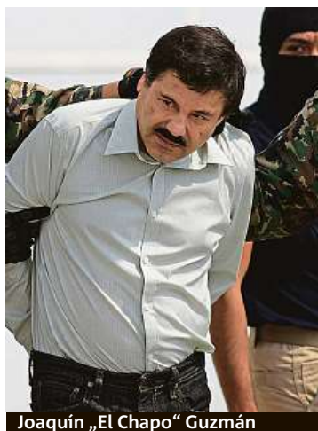
Joaquín „El Chapo“ Guzmán