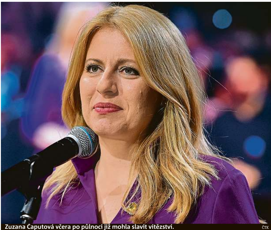
Zuzana Čaputová včera po půlnoci již mohla slavit vítězství.

Ve druhém kole volby hlavy státu na Slovensku nebyl výsledek rozdíl tak markantní jako v kole prvním.