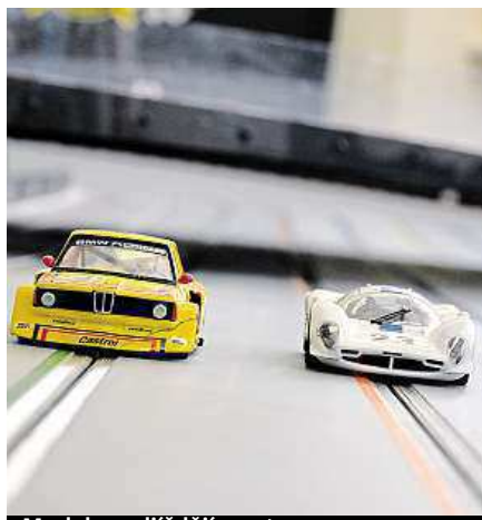
Modely podjíždějí most.