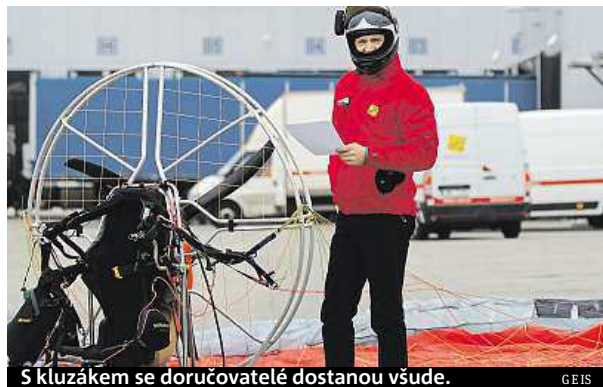
S kluzákem se doručovatelé dostanou všude.