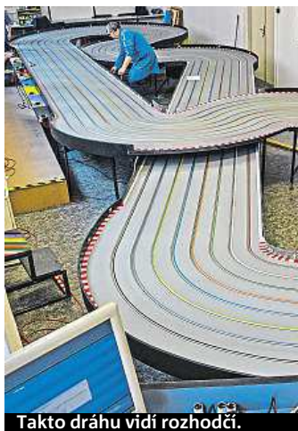
Takto dráhu vidí rozhodčí.