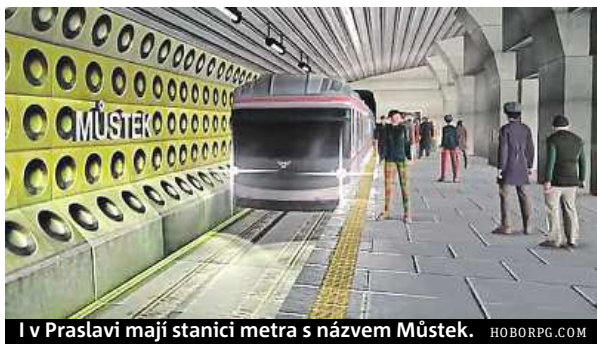
I v Praslavi mají stanici metra s názvem Můstek. HOBORPG.COM