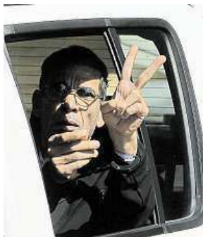
Unosce Mustafa

„Většina pasažérů zůstala v klidu, ale někteří mě pobavili. Jeden příjemný Egyptan při přistávání na Kypru obtelefonoval celou rodinu a přátele a hlásil: ‚Unesli mě, Muhammade. Unesli mě, Fátimo,‘ a tak dále. Další muž volal manželce, aby jí sdělil, že ukryl část svých peněz na tajném bankovním účtu. Nejzábav-