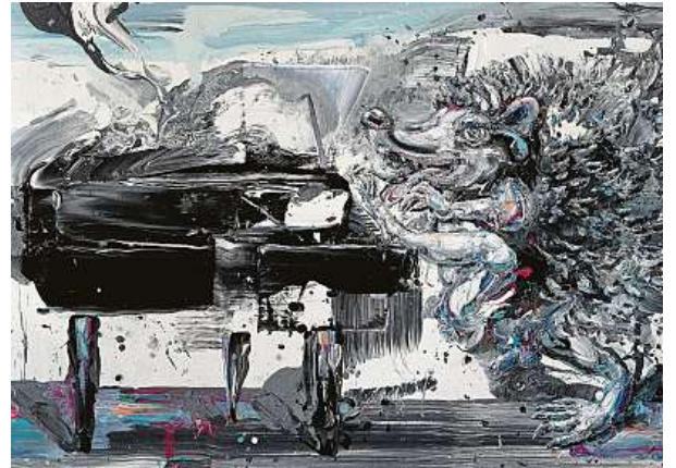
Dílo Virtuos ovlivnil skon amerického zpěváka a skladatele Jerryho Lee Lewise. Ten se na plátně proměnil v ježka.

„Mám jednoho obdivovatele tady na vsi, který se chodí dívat na mé obrazy – ještě na mokré – a sleduje techniku malby. A vzhledem k tomu, že je při těle, napadlo mě, co kdyby se náhodou převážil a spadl do barvy. Každý si může domyslet. Já mu říkal, ať se nenaklání, a on do toho padl,“ líčí malíř.