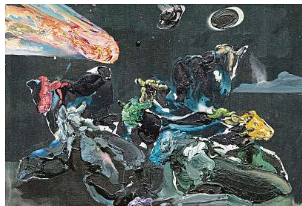
Autor je, dle svých slov, vnitřním ustrojením provokatér. Obraz Těleso věnoval krávám, kterými nepohne z místa ani armagedon.

FILIP JAROŠEVSKÝ filip.jarosevsky@metro.cz