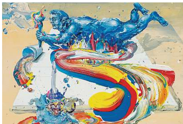
Pokud žijete s Rittsteinem v jedné vsi, máte jistou šanci, že se objevíte na jeho obrazech. Tlustý malíř je toho důkazem.

„Dílo Cestou I jsou mé vzpomínky z návštěvy jihoamerického Peru, kde jsem strávil nějaký čas na náhorní plošině a nechal jsem si vyprávět jak o historii Inků, tak o současnosti. Byl jsem ve městě Cuzco. Proto jsem se pokusil dát tyto věci dohromady na jeden obraz. Jsou tam jak odkazy na starou inckou kulturu, tak na současný život v Peru,“ vzpomíná umělec.