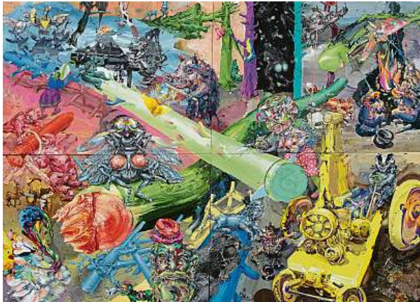
Dvě klády. Své malířské i kreslířské dílo rozvíjel od poloviny sedmdesátých let s až obsedantním nasazením. 4x MUZEUM KAMPA

„Vstupuji domů se špinavými botami, to jak z ateliéru, tak zvenku. Při malování tohoto