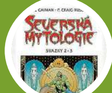
Severská mytologie 2 a 3 – vydalo Argo