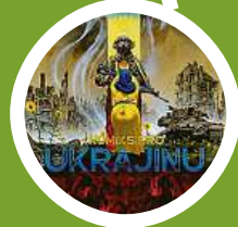
Komiks pro Ukrajinu – vydalo Crew 3x CREW A ARGO