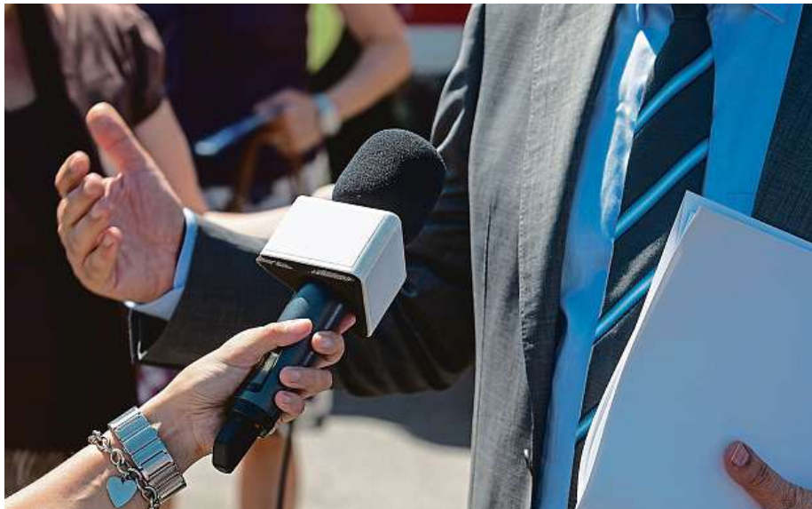
Tři čtvrtiny novinářek alespoň jednou čelily sexuálnímu obtěžování.

„Odchod významně častěji zvažují ženy, zejména generace novinářů a novinářek do 40 let a ti na řadových pozicích. To lze číst jako jasný signál, kterým skupinám pod-