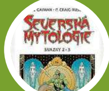
Severská mytologie 2 a 3 – vydalo Argo