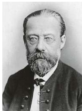
Bedřich Smetana

Bylo to v Jindřichově Hradci, když mu bylo asi 11 let. Kluci si vyrobili petardu, použili la-