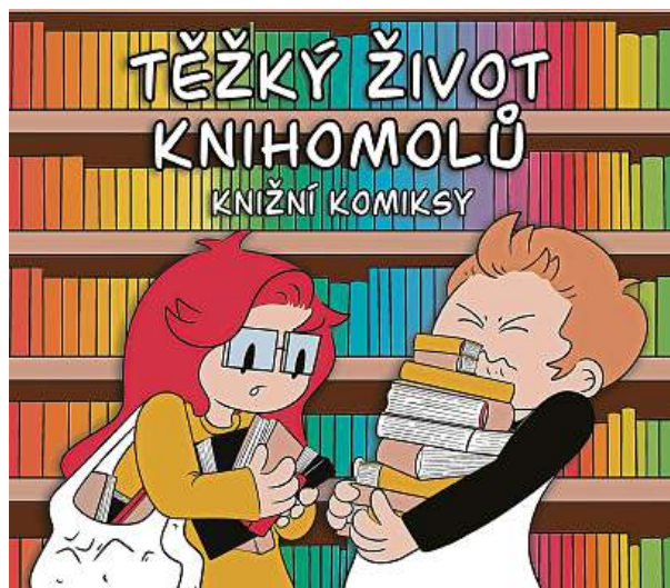
Knihomol je žrout knih. Ať už jako hmyz, nebo jejich milovník, který v nich neustále leží a nemívá jiné zájmy. 2x YACTU.CZ