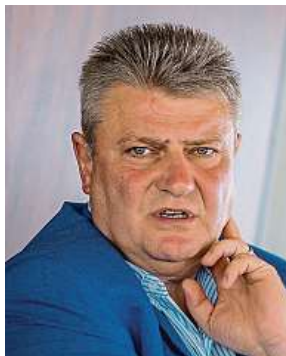
Šéf Českého tenisového svazu Ivo Kaderka

Sportovní funkcionář si kryl obličej kapucí, na dotazy novinářů neodpovídal. Policie ho viní z dotačního podvodu a ze zjednání výhody při zadání veřejné zakázky, za což mu v případě prokázání viny hrozí až desetileté vězení. Šedesátiletý Kaderka stojí v čele ČTS od roku 1998. V roce 2020 se stal také místopředsedou České unie sportu