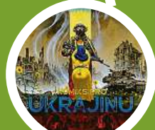
Komiks pro Ukrajinu – vydalo Crew 3x CREW A ARGO