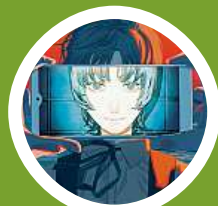
Sbohem, Eri – vydalo Crew