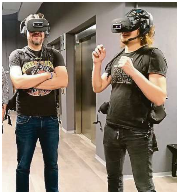
Ještě navlékneme rukavice se senzory a hurá do akce. ARCHIV

Lidé si často myslí, že atrakce, jaké provozujeme my, jsou ve světě už běžná věc. Ale zážitkových her ve virtuální realitě, kde se můžete volně pohybovat, existují zatím pouze jednotky a většinou ve Spojených státech. V Evropě de facto nemáme