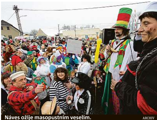
Náves ožije masopustním veselím.

„Program Poberounského masopustu, který patří mezi největší akce svého druhu v celém Středočeském kraji, začne na návsi v Zadní Třebani stylovým staročeským jarmarkem, na kterém budou kromě výrobků různých řemeslníků k dostání preclíky, perníky, koláče, pečené maso, medovina. Budou i koblihy, samozřejmý symbol ma-