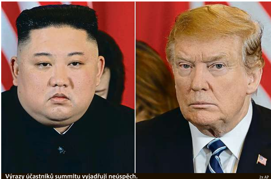
Výrazy účastníků summitu vyjadřují neúspěch.

Dvoudenní summit Spojených států a Severní Koreje včera v Hanoji skončil předčasně a bez dohody. Americký prezident Donald Trump přesto na tiskové konferenci hovořil o pokroku při jednání, zatímco severokorejská strana průběh vrcholné schůzky zatím nekomentovala. V Hanoji mělo být včera podepsáno společné prohlášení, ceremonie se však neuskutečnila. Stejně tak byl zrušen plánovaný společný oběd státníků. „Někdy musíte z jednání odejít, a to byla ta chvíle,“ poznamenal šéf Bílého domu po summitu. „Kim Čong-un má určité představy, které ale neodpovídají našim představám,“ sdělil Trump. Postoje obou stran