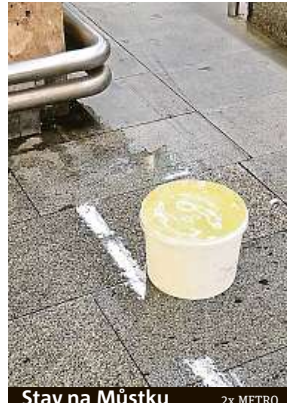
Stav na Můstku 2x METRO

procházela. Jarní počasí láká do hlavního města také mnoho turistů ze zahraničí.