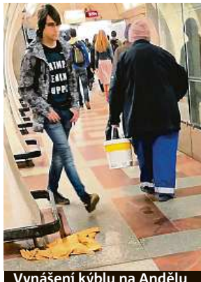
Vynášení kýblu na Andělu

Na přestupní stanici Můstek se dostanete v jedné části nástupiště k eskalátorům směrem na linku B pouze přes kýbly. Zachycují tu už ne kapající, ale tekoucí vodu v obou směrech na stejném místě. Také ve stanici Anděl se musí kontrolovat kbelíky častěji, i zde voda stéká na nástupiště intenzivně. „To se jim teď stává docela často,“ glosovala včera padající tektinu na Můstku studentka, která se spolužáky stanic