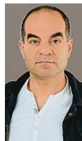
Khalil Baalbaki fotograf Zoo Praha