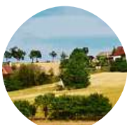
Měske Zehrovce Já volám akorát z okna.

Kolik měsíčně platíte za telefon (volání, SMS, data)?