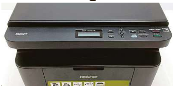
Tiskárna umí 0,39 koruny za stranu.

Ať už v následujících měsících čeká studenty cokoliv, levný, rychlý a spolehlivý tisk se hodí každému. Jak všech těchto vlastností dosáhnout? Jak se dá tisknout kvalitně a zároveň levně? Výrobci tiskáren ceny za tisk optimalizují různě.