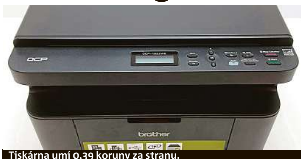
Tiskárna umí 0,39 koruny za stranu.

Ať už v následujících měsících čeká studenty cokoliv, levný, rychlý a spolehlivý tisk se hodí každému. Jak všech těchto vlastností dosáhnout? Jak se dá tisknout kvalitně a zároveň levně? Výrobci tiskáren ceny za tisk optimalizují různě.