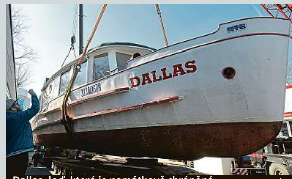
Dallas, loď, která je památkově chráněná

Na mnoha místech včera padaly teplotní rekordy. Například v Českých Budějovicích meteorologové naměřili 18,2 stupně Celsia. Znamená to překonání nejvyšší hodnoty pro 28. únor na této stanici. Doposud platil rekord z roku 1927, tehdy tam bylo 15,4 stupně. ČTK