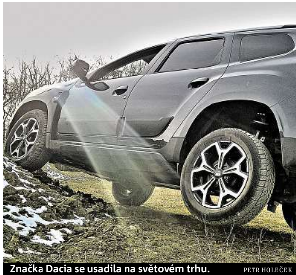
Značka Dacia se usadila na světovém trhu.

Displej navigačního systému už není utopený kdesi u podlahy a kouká se na něj líp, navíc plasty nepůsobí tolik levně, spolu s hezkými tlačítky a páčkami ovládání se úroveň interiéru hodně zvedla. Ačkoli se čelní sklo oproti minulé verzi posunulo o celých 100 milimetrů dopředu a má větší sklon, kabina stále moc prostorně nepůsobí. Posádka na zadních sedadlech by zasloužila více prostoru na nohy, mezi předními sedadly zase chybí nějaká pořádná odkládací schránka. Ani kufr není z říše snů – 445 litrů