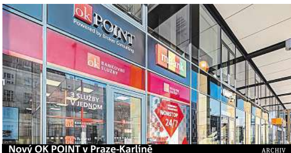
Nový OK POINT v Praze-Karlíně

První master-franšízantkou se stala ředitelka Jitka Příbylová, která provozuje jeden z našich nejúspěšnějších