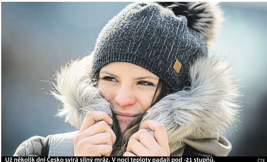
Už několik dní Česko svírá silný mraz. V noci teploty padají pod -21 stupňů.

Nižší teploty dělají potíže například prostorovým čidlům. Potvrzuje to Vojtěch Plechač z Čip Trading, který se zabývá prodejem bezpečnostních systémů. „Snižuje se citlivost čidel, mraz je