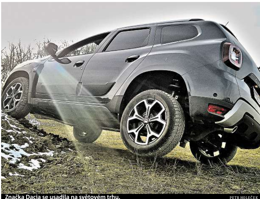
Značka Dacia se usadila na světovém trhu.

Začátkem roku se začala v Česku prodávat jeho druhá generace. Duster má stále nízkou cenovku, stále vypadá dobře a stále je v terénu boží – což jsem si vyzkoušel na rozbahněné trase v hummer centru. Laik pozná zvenčí jen málo změn, hlavně nové