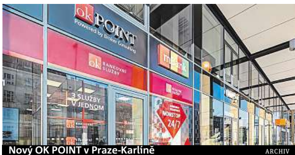
Nový OK POINT v Praze-Karlíně

První master-franšízantkou se stala ředitelka Jitka Příbylová, která provozuje jeden z našich nejúspěšnějších