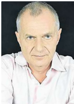
Roman Budský ARCHIV

Ano, a nemyslím si to jen já, ale také většina řidičů. Ti v průzkumech pravidelně uvádějí, že jsou zde dopravní značky užívány nadměrně. Problém je nejen se značkami, které jsou v ulicích umístěny zcela zbytečně nebo je jich příliš mnoho za sebou, ale také s těmi, jež řidiči ani nemů-