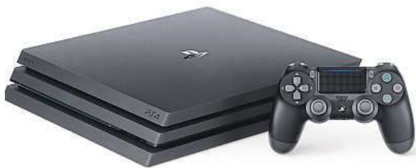
PlayStation nikdy nezklame.

Inovaci prošel i bezdrátový ovladač DualShock 4. Světél-