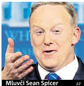
Mluví Sean Spicer

Prezident USA nemá dobrý vztah s některými médii a ta zase s ním. Od jeho lidí navíc unikají informace.