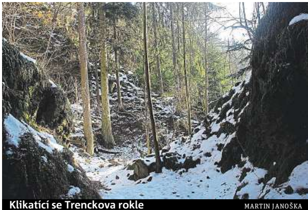
Klikatící se Trenckova rokle

U Tišnova se do Svatky z pravé strany vlévá říčka, která vytvořila jedno z nejromantičtějších a nejdívočejších údolí na Českomoravské vrchovině. Mezi obcemi Habří a Skryje se zařezala do velmi tvrdých vyvřelých a přeměněných hornin a vytvořila údolí, které se místy podobá proslulému Prielomu Hornádu ve Slovenském ráji. V mapě nenápadná říčka se ve své první polovině jmenu-