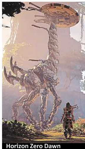
Horizon Zero Dawn