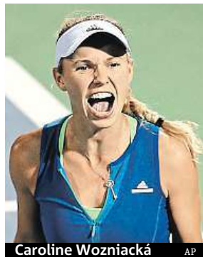
Caroline Wozniacká

Bývalá tenisová světová jednička bude hrát v květnu na kurtech Sparty ve Stromovce.