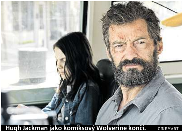
Hugh Jackman jako komiksový Wolverine končí. CINE MART

Hugh Jackman poprvé propůjčil svou elektrizující energii mutantovi známému jako Wolverine už v roce 2000, je snad nejslavnějším hrdinou série X-Men. Je i postavou, kte-