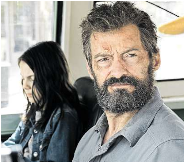
Hugh Jackman jako komiksový Wolverine končí. CINEMART

Hugh Jackman poprvé propůjčil svou elektrizující energii mutantovi známému jako Wolverine už v roce 2000, je snad nejslavnějším hrdinou série X-Men. Je i postavou, která Hughu Jackmanu proslavi-