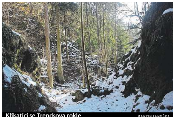
Klikatící se Trenckova rokle

U Tišnova se do Svatky z pravé strany vlévá říčka, která vytvořila jedno z nejromantičtějších a nejdívočejších údolí na Českomoravské vrchovině. Mezi obcemi Habří a Skryje se zařezala do velmi tvrdých vyvřelých a přeměněných hornin a vytvořila údolí, které se místy podobá proslulému Prielomu Hornádu ve Slovenském ráji. V mapě nenápadná říčka se ve své první polovině jmenu-