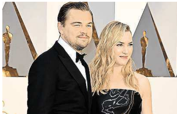
DiCaprio s hereckou kolegyní Kate Winsletovou

Šťastného konce se ale dočkal i jiný příběh. Slavný skladatel Ennio Morricone čekal na pozlacenou sošku ještě déle, stejně jako u DiCapria se odborníci mnohokrát shodli, že měl vyhrát, ale akademici rozhodli jinak. Až hudba k filmu Quentin Tarantina Osm hrozných znamenala úspěch a dojatý skladatel si převzal ocenění, které tak trochu putuje i do Česka, protože skladby s ním nahráli Český národní symfonický orchestr.