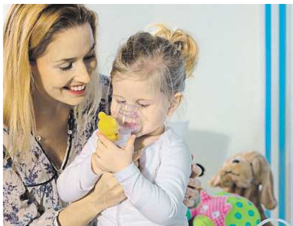
Inhalace pomáhá dětem i dospělým.

Zvláště u „školkařů“ se zejména v zimním období vyskytují poměrně často a nezbývá než s nimi úporně bojovat. I samotná rýma je nepříjemná pro dospělé, natož pro dítě. Odsávání přináší pouze krátkodobou úlevu a dny s rý-