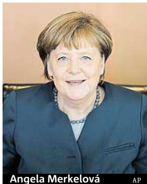
Angela Merkelová

Německá kancléřka Angela Merkelová ale stanovení horní hranice pro počet uprchlíků přijímaných do Německa znovu odmítla. „Jsem velmi optimistická, že se nám evropská cesta podaří. Nenastal čas na