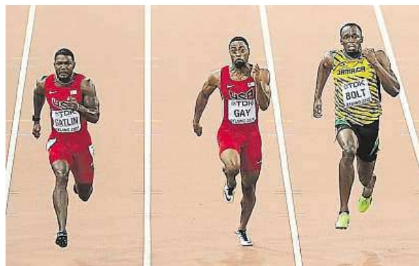
Who will cross the finish line first?

Find these words in the grid: lane, sprint, track, athlete, hurdle, baton, relay, starter, gun