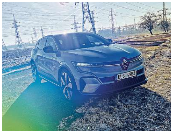
Úzká světlá, ladná silueta – nám se design Méganu velmi líbí.