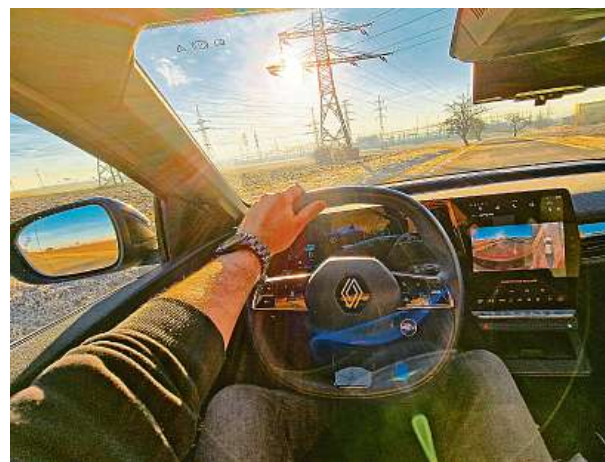
Navigaci si vzal na triko Google. Vypočítá vám i stav baterie v cíli.

Má slavné jméno svých předchůdců, ale je zcela jiný. Tenhle Renault Mégane přijel ve 100% elektrické verzi. Překvapilo nás, jak příjemně se s ním jezdí. Jeden z nejlepších elektromobilů.