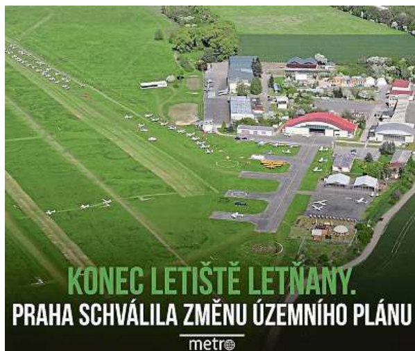
Pražské letiště v Letňanech by mělo skončit a na místě začnou stavět developeri. Pociť to nejen Praha 18 a 19, ale i Praha 9 a okolí.