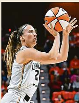
Sabrina Ionescuová

Utkání hvězd NBA zpestří souboj pohlaví. Ve střelbě trojek se v sobotu 17. února poměří Stephen Curry a Sabrina Ionescuová. Pětatřicetiletý Curry dal nejvíce trojek v historii NBA (3585). Úspěšnost ve střelbě z dálky má 42,6 procenta. O devět let mladší hvězda New Yorku Liberty Ionescuová měla v minulém ligovém ročníku pro změnu při trojkách úspěšnost 44,8 procenta.