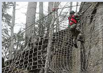
Vojáci v náročném závodě