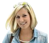
TROTAMUNDOS VĚČNÁ CESTOVATELKA A OBDIVOVATELKA ZAJÍMAVÝCH KULTUR

ní piraň. Nejsem žádný rybář a dlouho nevydržím sedět bez mluvení, ale piraňu jsem si ulovit chtěla. Proto jsme na jezeru vypnuli motor a na syrové maso se je snažili chytat. Larry jel jak o závod – co návnada, to jedna ryba. Mně návnadu spíš okusovaly, ale nevzdávala jsem se. Po pár minutách se to i mně konečně povedlo a postupně jsem ulovila celkem čtyři pirani. Byla jsem na sebe náležitě pyšná a také jsem se těšila, až si je uděláme k obědu. Když jsme doložili, přišel čas na koupání. Ve stejném jezeru a na stejném místě, kde jsem před chvílí vylovila pirani, jsem skočila do vody. Byla jsem ubezpečena, že pirani útočí jen v případě otevřené rány, takže je to plně bezpečné. Úplně komfortně jsem se tedy ve vodě necítila, ale místním se má důvěřovat, a v Amazonii to platí dvojnásobně. Pocit osvěžení se bohužel nedostavil, protože teplota vody byla jak horké kafe, ale zajímavou historku jsem díky tomu získala.