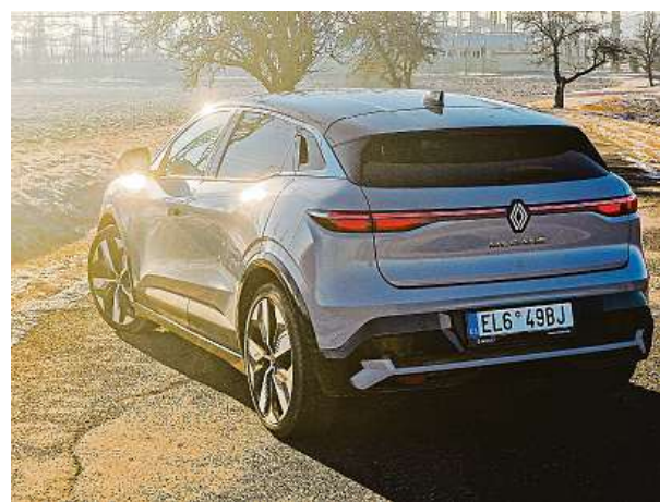
Renault auto vyrábí v továrně ElectriCity v Douai ve Francii. 3x METRO

Na papírový dojezd 450 kilometrů na jedno nabití jsme se sice nedostali, ale dojezd 400 kilometrů auto zvládlo. Auto je stejně jako před dvěma lety postaveno na platformě CMF-EV, ta umožňuje zástavbu velmi tenké 110mm baterie s kapacitou 60 kWh. Díky ní kleslo těžiště vozu oproti spalovací verzi o 90 milimetrů. A protože je váha auta směřovaná na předek, včetně elektromotoru i palubní nabíječky, je s ním jízda zájímavá – ochotně se skládá do zatáček, ochotně z nich vy-