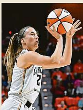
Sabrina Ionescuová

Utkání hvězd NBA zpestří souboj pohlaví. Ve střelbě trojek se v sobotu 17. února poměří Stephen Curry a Sabrina Ionescuová. Pětatřicetiletý Curry dal nejvíce trojek v historii NBA (3585). Úspěšnost ve střelbě z dálky má 42,6 procenta. O devět let mladší hvězda New Yorku Liberty Ionescuová měla v minulém ligovém ročníku pro změnu při trojkách úspěšnost 44,8 procenta.