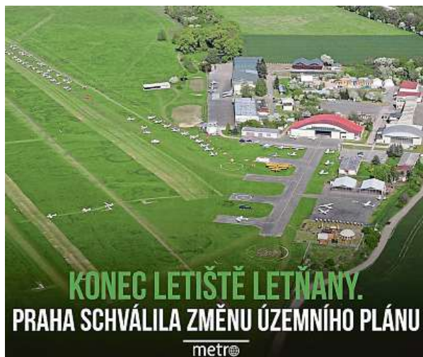
Pražské letiště v Letňanech by mělo skončit a na místě začnou stavět developeři. Pociť to nejen Praha 18 a 19, ale i Praha 9 a okolí.