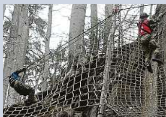
Vojáci v náročném závodě