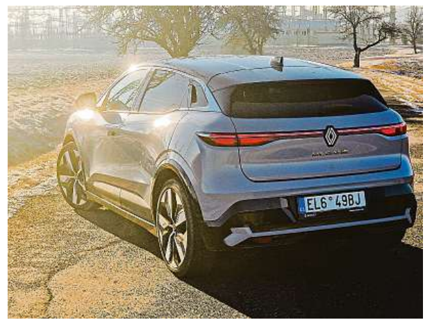
Renault auto vyrábí v továrně ElectricCity v Douai ve Francii. 3x METRO

Na papírový dojezd 450 kilometrů na jedno nabití jsme se sice nedostali, ale dojezd 400 kilometrů auto zvládlo. Auto je stejně jako před dvěma lety postaveno na platformě CMF-EV, ta umožňuje zástavbu velmi tenké 110mm baterie s kapacitou 60 kWh. Díky ní kleslo těžiště vozu oproti spalovací verzi o 90 milimetrů. A protože je váha auta směřovaná na předek, včetně elektromotoru i palubní nabíječky, je s ním jízda zajímavá – ochotně se skládá do zatáček, ochotně z nich vy-