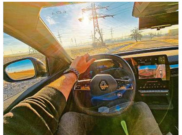
Navigaci si vzal na triko Google. Vypočítá vám i stav baterie v cíli.

Má slavné jméno svých předchůdců, ale je zcela jiný. Tenhle Renault Mégane přijel ve 100% elektrické verzi. Překvapilo nás, jak příjemně se s ním jezdí. Jeden z nejlepších elektromobilů.