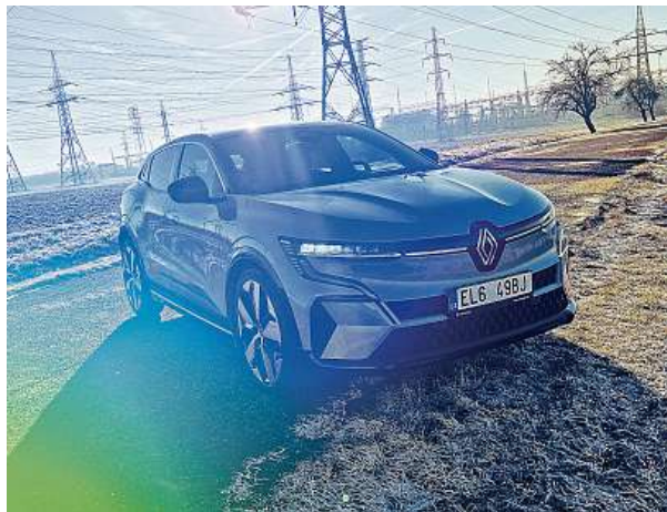
Úzká světlá, ladná silueta – nám se design Méganu velmi líbí.