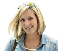
TROTAMUNDOS VĚCNÁ CESTOVATELKA A OBDIVOVATELKA ZAJÍMAVÝCH KULTUR

ni piraň. Nejsem žádný rybář a dlouho nevydržím sedět bez mluvení, ale piraňu jsem si ulovit chtěla. Proto jsme na jezeru vypnuli motor a na syrové maso se je snažili chytat. Larry jel jak o závod – co návnada, to jedna ryba. Mně návnadu spíš okusovala, ale nevzdávala jsem se. Po pár minutách se to i mně konečně povedlo a postupně jsem ulovila celkem čtyři pirani. Byla jsem na sebe náležitě pyšná a také jsem se těšila, až si je uděláme k obědu. Když jsme doložili, přišel čas na koupání. Ve stejném jezeru a na stejném místě, kde jsem před chvílí vylovila pirani, jsem skočila do vody. Byla jsem ubezpečena, že pirani útočí jen v případě otevřených rány, takže je to plně bezpečné. Úplně komfortně jsem se tedy ve vodě necítila, ale místním se má důvěřovat, a v Amazonii to platí dvojnásobně. Pocit osvěžení se bohužel nedostavil, protože teplota vody byla jak horké kafe, ale zajímavou historku jsem díky tomu získala.