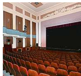
Radnice připravuje rekonstrukci Domu kultury.

tech 1954 až 1955, je příkladem tradicionalismu. Je dominantou Mírového náměstí, které vzniklo rovněž v architektonickém stylu. Před časem nechala radnice opravit vnější plášť budovy. Řemeslníci vyměnili okna a opravili fasádu. Práce vyšly na téměř 30 milionů korun. ČTK