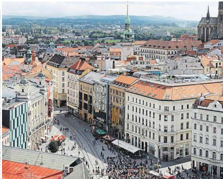
Aktuální podoba dnes již náměstí Svobody