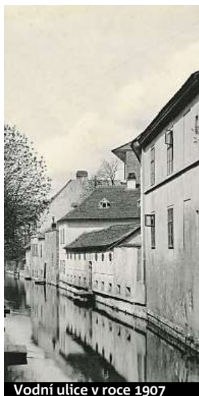
Vodní ulice v roce 1907