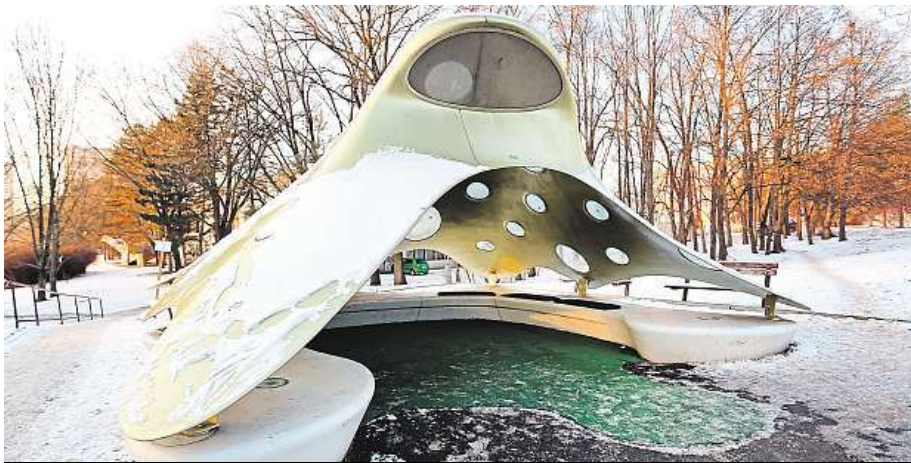
Nápady, jak vylepšit okolí a rozjet nekomerční projekty můžete posílat do konce února.

Projekt participativního rozpočtu s účastí obyvatel schválilo Brno už loni. Letos začne sbírat podklady, aby se nejúspěšnější projekty uskutečnily v příštím roce. „Nápady je možné přihlašovat do konce května,“ říká Koláčný. Přihlášku lze podat elektro-