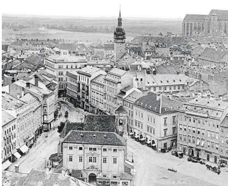
Někdejší Velké náměstí na snímku z roku 1867