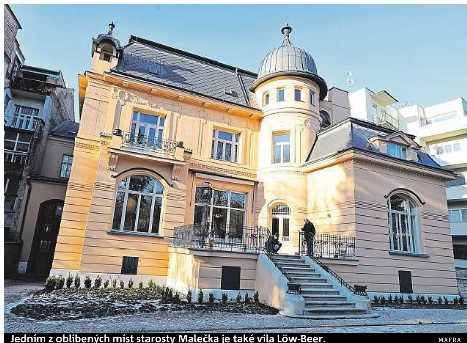
Jedním z oblíbených míst starosty Malečka je také vila Löw-Beer.

V Husovicích bych jmenoval sokolovnu a sportovní areál, kam jsem chodil kdysi hrát basketbal, a pak okolí kostela, kam jsem chodil léta do školy. Na Černých Polích je mým oblíbeným místem starší sestra vily Tugendhat – Löw-Beerova vila s krásnou zahradou a kinokavárna na náměstí SNP, kam jsme chodili jako mládež školou povinná. Pokud jde o část Zábrdovic, patří pod Brno-sever, pak bych zmínil obrovský starší platan před radnicí na Bratislavské. RADEK BABIČKA