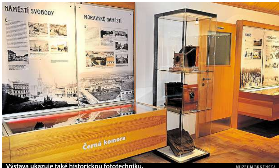
Výstava ukazuje také historickou fototechniku.