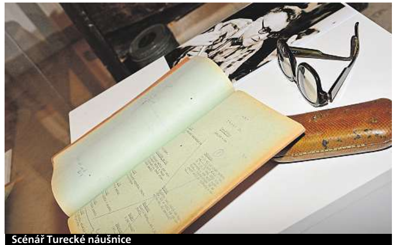
Scénář Turecké náušnice