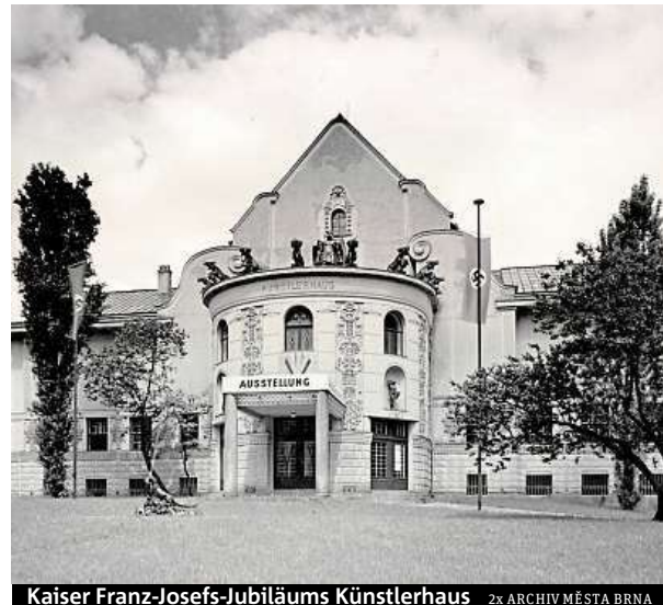
Kaiser Franz-Josefs-Jubiläums Künstlerhaus 2x ARCHIV MĚSTA BRNA