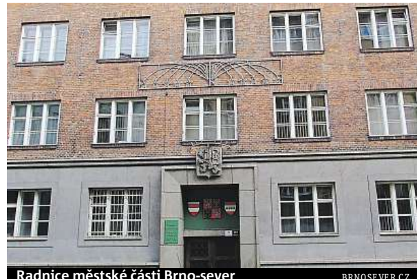
Radnice městské části Brno-sever

V oblasti Brno-sever je hned několik netradičních sportovišť. Jaká to jsou a chystáte ještě nějaká další?