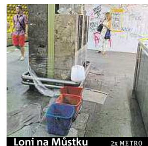
Loni na Můstku