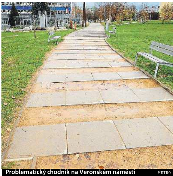
Problematický chodník na Veronském náměstí

Jedná se o frekventovanou spojnici mezi supermarketem a školou na Veronském náměstí. Skrze školní pozemek si cestu zkracují stovky lidí, kteří bydlí za školou. Chodník v parku tvoří betonové dlaždice střídající se s udupanou hlínou s pískem. Často se tak dlaždice střídají s loužemi a bahnem namísto s písčným platem, které tu pravděpodobně mělo být. „Bohužel tento mlat je docela náročný na údržbu, musí se tak jednou za rok válcovat, respektive dosypávat, aby nevznikaly