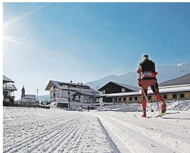
Užijte si skvělé počasí a vyrazte. CRESTCOM.CZ

Závod nazvaný Gseiser Tal Lauf patří k nejnavštěvovanějším dálkovým závodům a letos se bude konat jeho již 23. ročník. Na startovní čáru tratí dlouhé 30 nebo 42 km se