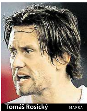
Tomáš Rosický MAFRA

Kapitán fotbalové reprezentace Tomáš Rosický má znovu zdravotní problémy.