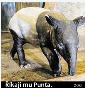
Říkají mu Punťa.

V zoo bylo pokřtěno jedno z nejvzácnějších loňských mláďat. Sameček tapíra čabrakového dostal od své kmotry, herečky Lenky Krobotové jméno Budak Punťa. To lze z malajstiny přeložit jako kluk Punťa. Malému tapírovi se už vytváří zbarvení typické pro dospělá zvířata.