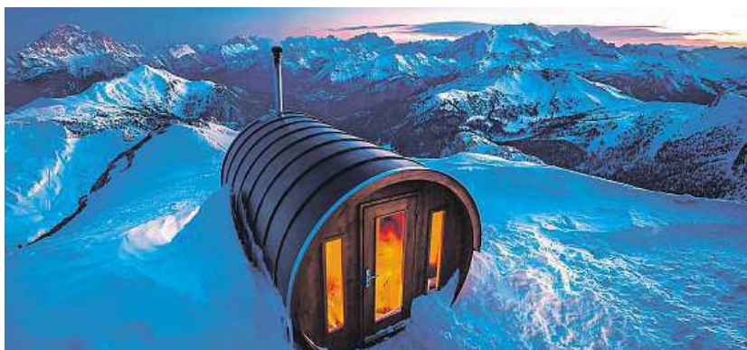
Nahore jsou iglú, v nichž můžete přespát. Na snímku dole je sauna v Dolomitech a vpravo Kronplatz.