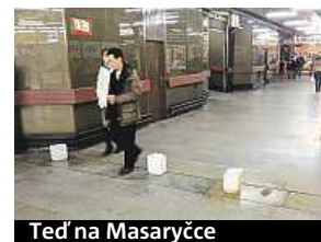
Teď na Masaryčce

Před dvěma lety na Dejvické ale ani kbelíky nepomohly. V metru se objevilo vody jako v bazéně. Natekla kvůli tomu, že dělníci v ulici nad stanicí prokopli vodovodní potrubí. FILIP JAROŠEVSKÝ