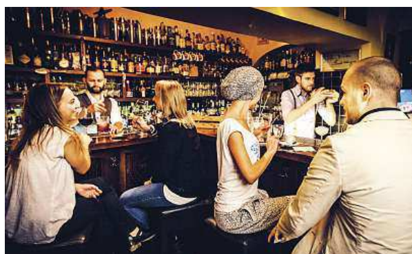
Bar, kam by Ernest Hemingway rád chodil.