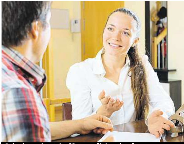
Právní poradenství můžete využít bezplatně.

Pomáhají lidem, kteří se ocitli na okraji předlužení, případně mají jiné potíže se zákonem a nemohou si dovolit placenou konzultaci u advokáta.